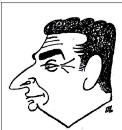
Caricatura per Del Arco a La Vanguardia