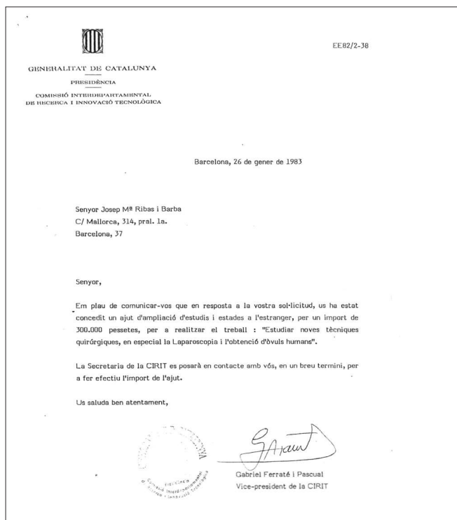
Fig.2.- Ajut d'ampliació d'estudis i estades a l'estranger per part de la CIRIT de la Generalitat de Catalunya.