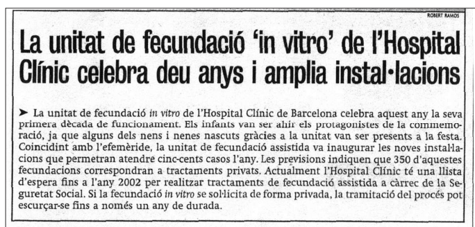
Fig.4.- Notícia a l'Avui del 21 de Febrer de 1998 sobre la celebració del 10 anys de funcionament de la unitat de F.A. i la inauguració de les noves instal·lacions.