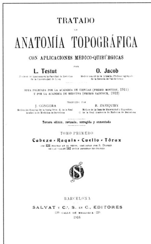
Portada del Tractat d'Anatomia Topogràfica