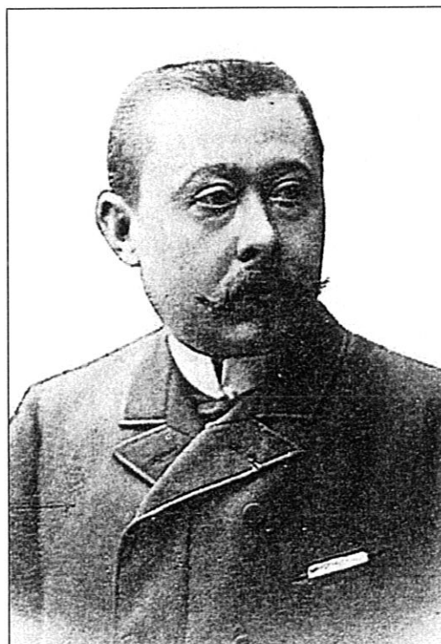
Jean Léo Testut (1849-1925)