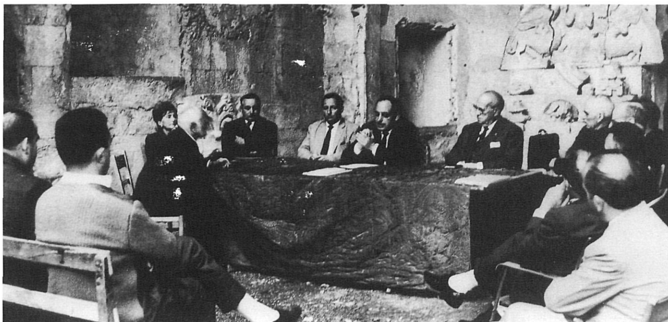
Amics de Besalú i el seu Comtat. Assemblea a l'absis de Santa Maria, 1963.