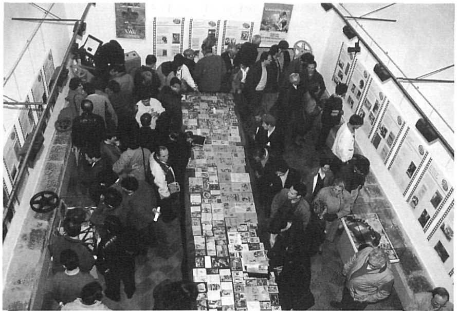
Exposició «Cent anys de cinema a Torroella de Montgrí» (Capella de Sant Antoni, 1995).

Per a les escoles preparem una sèrie d'activitats, semblants a les anteriors, encaminades a ensenyar-los el nostre municipi. Són més didàctiques que les preparades per als grups i es poden dividir en tres apartats: el museu, les sortides a llocs d'interès i els tallers didàctics. El museu els serveix d'introducció a l'activitat: allà coneixen quins són els aspectes més destaca-