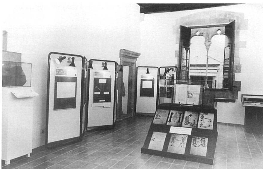
Exposició «Els pergamins municipals» (1983, sala 7).

En segon lloc, i dins del mateix nom –Centre d'Estudis i Arxiu–, la voluntat de convertir l'entitat en un centre de compilació i de difusió de les obres editades sobre aquesta zona, així com en el lloc on s'ubicaria l'Arxiu Històric Municipal de Torroella de Montgrí.