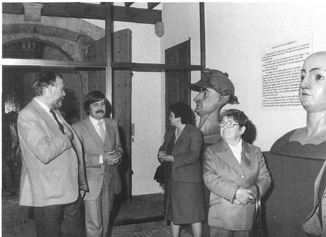
Inauguració del Museu del Montgrí i el Baix Ter, 1986.