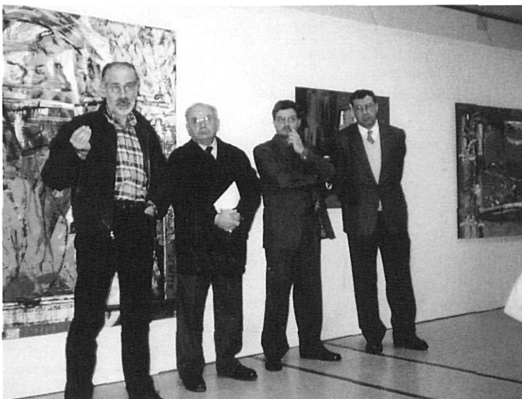
Inauguració de l'exposició.

tot, l'artista desitja que les seves obres siguin considerades com quelcom provisional.