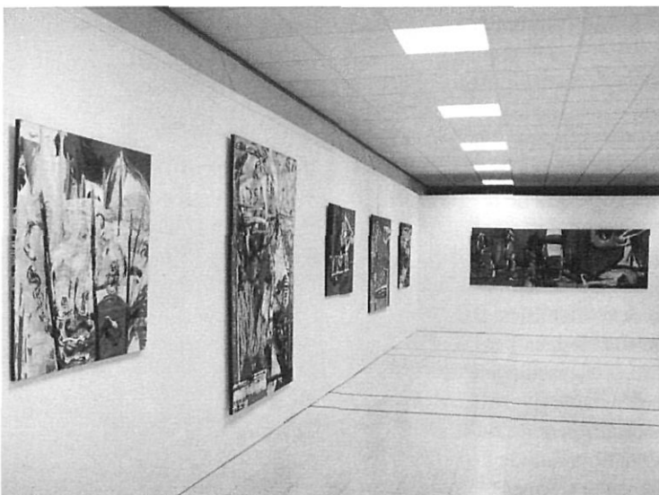
A la dreta, El Centro, gouache sobre cartró, 1968. A baix, un aspecte de l'exposició "Sarrià, mon amour".

està il·lustrada amb les pintures que abracen els anys 1967 a 1973, reproduïdes en bitò, amb un text que documenta las vicissituds de la infantesa i de l'adolescència en el poble, a l'època franquista: les dificultats que tenia un jove per pintar i