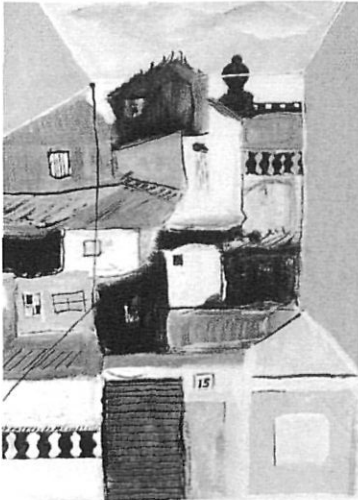
Teulats, gouache sobre paper, 1971.

excepte en els murals, ha estat sempre el paper, el cartró i les teles. També ha anat variant els formats, pràcticament els ha duplicat.