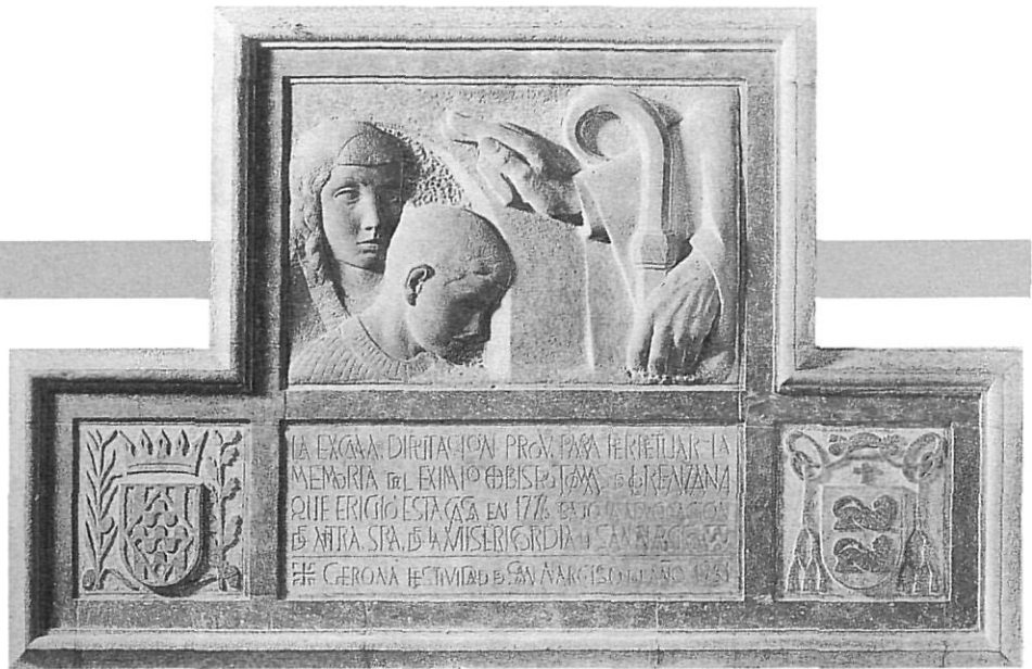
Placa d'homenatge al bisbe Lorenzana, de Domènec Fita i Joaquim Masramon, a la Casa de Cultura de Girona, 1951.