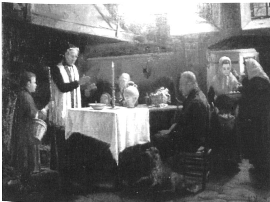
Lo salpàs, oli de Marian Vayreda, 1878.

ment d'un estadi d'espiritualitat. És a partir d'aquesta nova identitat, redimida de l'instint i el materialisme pel dolor, que cobra sentit la decisió de l'Albert d'allunyar-se del món.