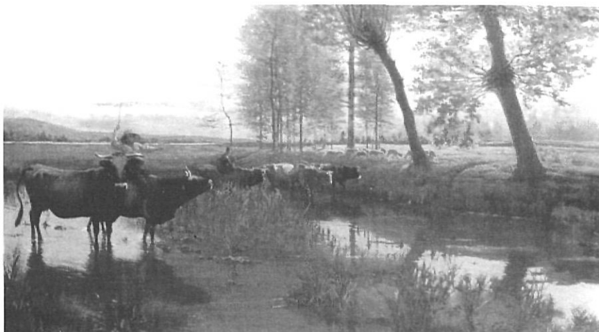
Un capvespre, oli de Marian Vayreda, 1898

Anys després de la contesa bèl·lica, Vayreda va escriure els seus Records de la darrera carlinada (1898), en què rememorava alguns d'aquells esdeveni-