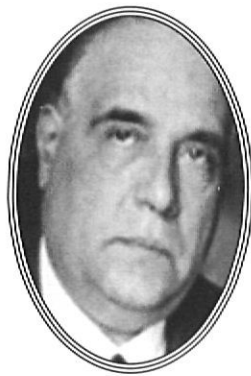
Eugeni d'Ors (1881-1954)