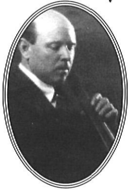
Pau Casals (1876-1973)