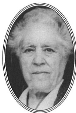
Caterina Albert (1876-1966)

No es tracta només d'un exercici especulatiu, sinó que al darrere hi ha la voluntat d'aportar noves claus d'interpretació del personatge, situant-lo en el temps que va viure. Ben segur que aquesta petita reflexió ens ajudarà a resituar Masó en el seu temps com un personatge contemporani amb idees, valors i voluntats molt més properes a nosaltres del que es pugui despendre d'una lectura massa apressada i simplista.