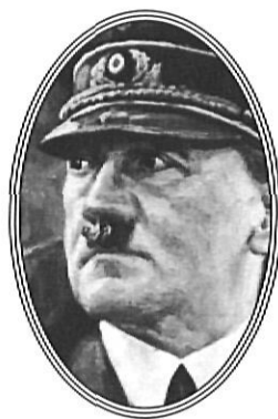
Adolf Hitler (1889-1945)