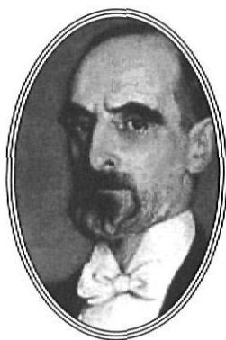
Francesc Cambó Batlle (1876-1947)