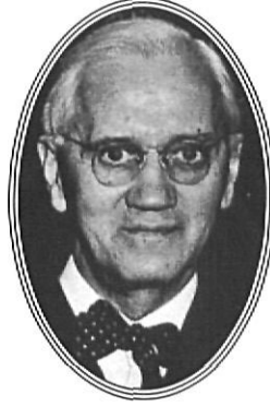
Alexander Fleming (1881-1955)