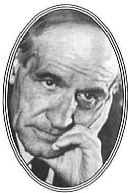
José Ortega y Gasset (1883-1955)