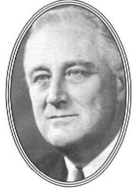
Franklin Delano Roosevelt (1882-1945)