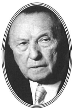
Konrad Adenauer (1876-1967)