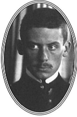
Walter Gropius (1883-1969)