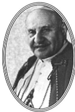
Joan XXIII (1881-1963)