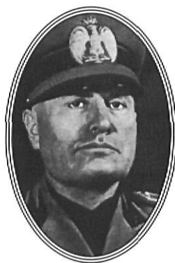
Benito Mussolini (1883-1945)