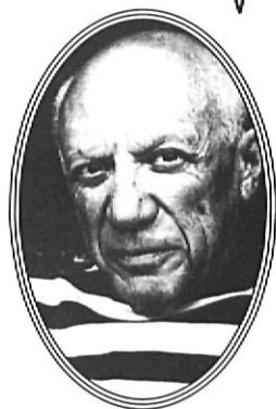
Pablo Ruiz Picasso (1881-1973)