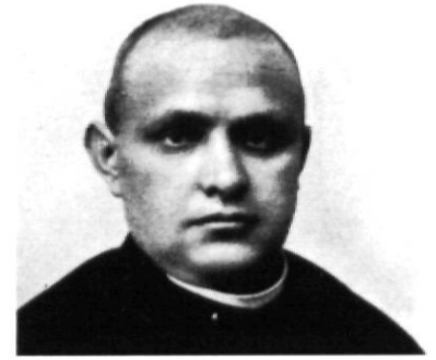
Antoni M. Alcover.