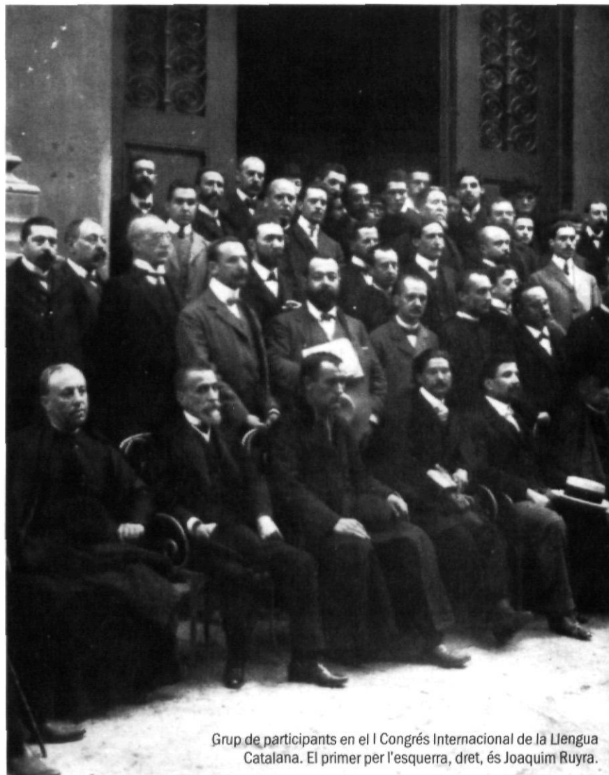
Grup de participants en el I Congrés Internacional de la Llengua Catalana. El primer per l'esquerra, dret, és Joaquim Ruyra.

Del 13 al 17 d'octubre de 1906, ara fa 100 anys, tingué lloc a Barcelona el I Congrés Internacional de la Llengua Catalana, amb l'objectiu d'estudiar el català «en la seva íntima estructura».