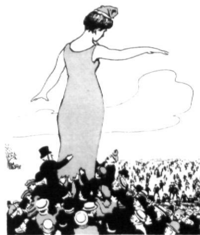
El Congrés, vist per La Tralla (19 d'octubre de 1906).

Amb la descripció de les sessions inaugurals i complementàries, celebrades en el I Congrés Internacional de la Llengua Catalana, podem veure les transformacions i canvis que la nostra llengua ha sofert al llarg del temps. Cent anys després, podem llegir com escrivien el català els nostres avantpassats, què pensaven sobre el tema lingüístic escriptors catalans, valencians o balears. Quina era la situació en què es trobava la llengua i quines actuacions necessitava per millorar-la. La nostra llengua és el nostre transport i la dedicació dels lingüistes va ser decisiva per a l'ortografia, gramàtica, morfologia i sintaxi de la llengua catalana. L'estudi de la llengua, en tots els seus àmbits, ha sigut prioritari per a la seva difícil supervivència. El món acadèmic s'implica en el treball per a una correcta lectura i escriptura. La universitat insisteix en la divulgació i coneixença