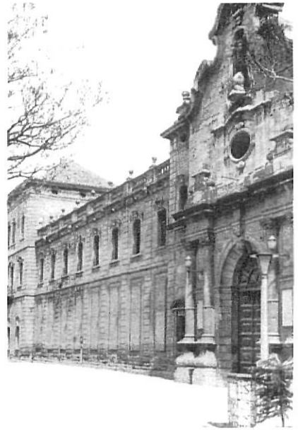
Porta principal de la Universitat de Cervera.

Avui Cervera s'ha apropat a Girona amb la facilitat de l'Eix Transversal, en un extrem del seu recorregut. La ciutat encara està presidida per l'edifici universitari, que es