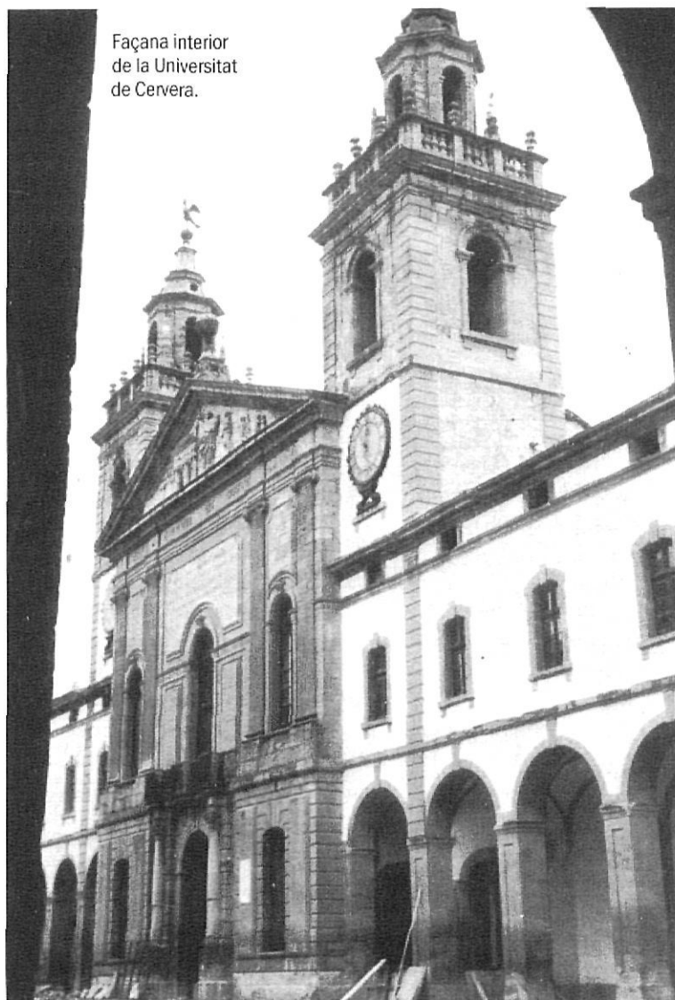
Façana interior de la Universitat de Cervera.