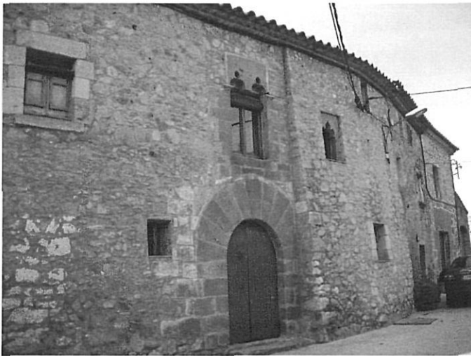
Notable casal goticorenaientista situat fora i prop dels murs de Vilacolum.

Durant l'alta edat mitjana fou un llogarret insignificant dins la parròquia de Sant Feliu de la Garriga del qual en tenim constància documental a partir de l'any 1060,(23) però amb restes arqueològiques d'èpoques molt anteriors. L'única referència que fins ara