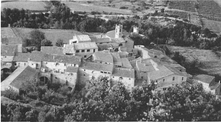
Vista del petit conjunt urbà de les Escaules nascut a l'entorn d'un hospital vinculat a l'orde del Temple, situat a uns tres-cents metres de la primitiva església i de la seva sagrera. L'església que veiem en aquestes imatges fou bastida en el segle XVII; fins llavors els vilatans havien utilitzat el temple original, avui desaparegut, situat a tocar el salt de la Caula.

Les Escaules. Les referències més reculades que coneixem d'aquest poble (actualment dins el municipi de Boadella) corresponen a la primera meitat del segle IX, en una data inconcreta del regnat de Lluís el Pietós (814-840). Aquest cenobi torna a aparèixer esmentat en sengles documents dels anys 844 i 899. En aquesta darrera data el monestir havia perdut la seva independència. La decadència de la casa es devia accentuar en els anys posteriors i en el 1002 Sant Martí de les Escaules és esmentada com una simple parròquia. Seguint el procés normal de la majoria de les esglésies del país, el temple fou dotat de sagrera, a l'entorn de la qual es construïren cases i cellers. Aquesta sagrera és esmentada en un document de 1279.(2)