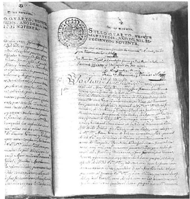
Arxiu Històric Municipal de Sils

La primera notícia documentada de l'arxiu dels