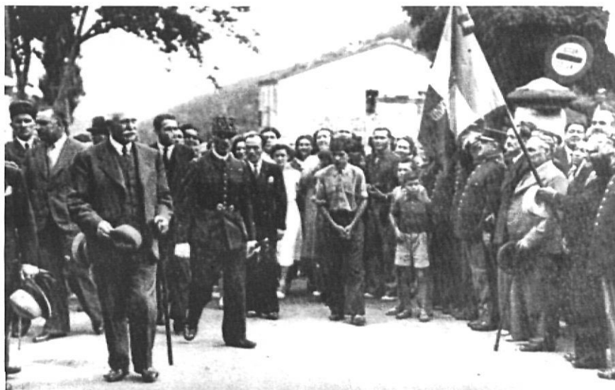
El 25 de juliol de 1939 el mariscal Pétain arribà al Portús, procedent de Girona. Fou rebut per una delegació d'excombatents d'aquella població de la Catalunya Nord.

Aviat el mariscal s'adonà que aquell era el bon camí per aconseguir la normalització, almenys relativa, de les relacions hispanofranceses. Les gestions de l'ambaixador amb el seu govern culminaren a primers de juliol. D'una banda tornà l'or per la frontera d'Euskadi i les obres d'art del patrimoni espanyol ho feren per la frontera de Girona. Pétain volia estar segur