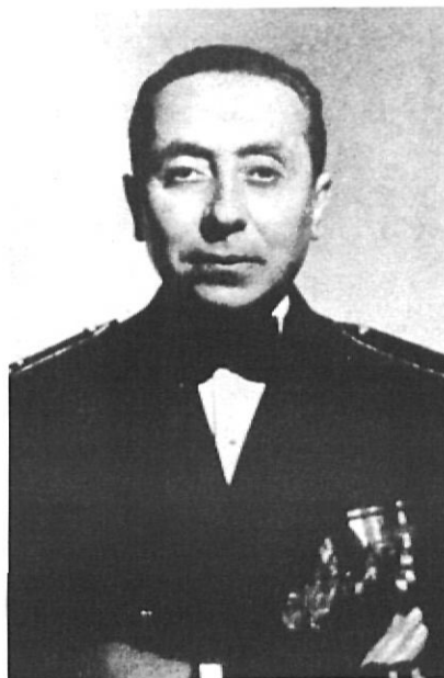
El governador civil, Paulino Coll, únic testimoni gironí de la trobada Franco-Pétain.

El primer de setembre les tropes alemanyes envaïren Polònia. Fou el