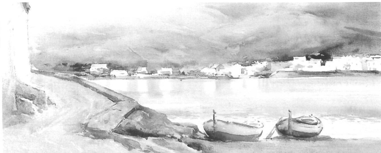
El Poal , de Ramon Reig, 1955.

Igual que Núñez, Ramon Reig sortia amb els seus alumnes més avantatjats a pintar a l'exterior per tal de captar el paisatge amb la llum, el color, l'atmosfera, el pas de les estacions, i la diversitat del paisatge empordanès, elements impossibles de percebre dins l'aula. Alumnes seus es convertiren en excel·lents artistes