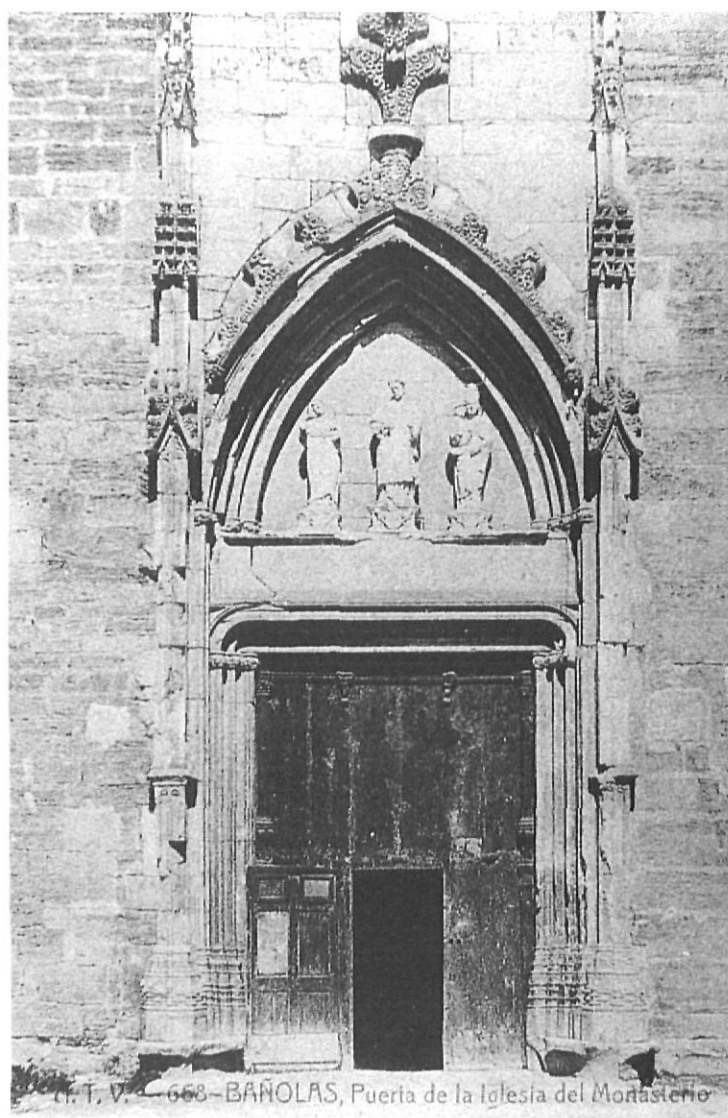
FONS D'IMATGES DEL PLA DE L'ESTANY-9

Un dels elements més característics del monestir de Sant Esteve de Banyoles ha estat des de sempre la seva portalada d'estil gòtic tardà, definida per l'erudit local Mn. Constans com una «puerta de piedra labrada en un gòtico decadente»(1). L'obra, tal com avui la veiem davant la plaça del monestir, fou construïda al llarg del segon quart del s. XVI, però en origen tenia un grup escultòric en el seu timpà que contenia les figures de sant Benet, sant Esteve i sant Martirià. Malauradament fou destruït en part durant els episodis de la Guerra Civil (1936-1939), tot i que alguns fragments de les estàtues d'alabastre avui es poden visitar en la galeria gòtica del Museu Arqueològic Comarcal de Banyoles (MACB).