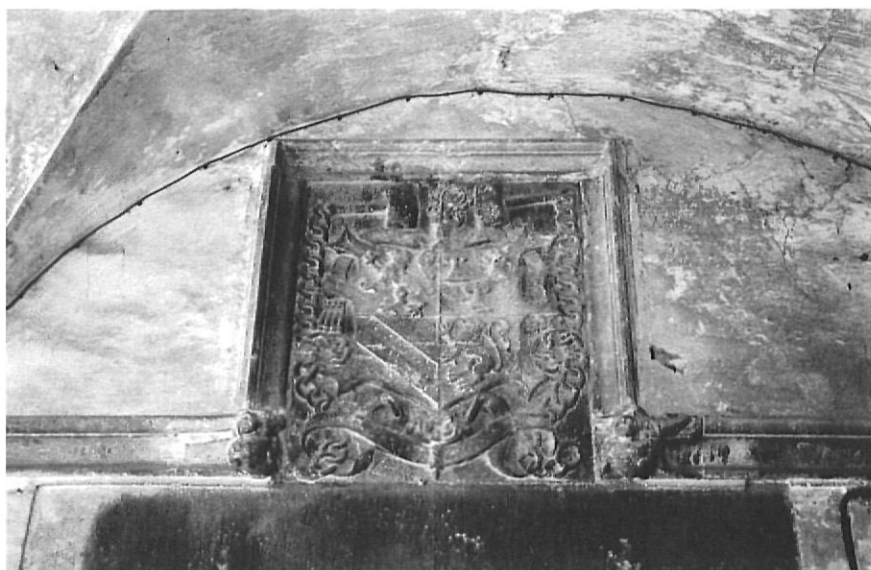
Escut de l'abat Miquel Sampsó en el claustre del monestir.

monjo almoïner, destacà per la fundació al monestir de l'escola o Mestrat de Cant per a 4 escolars i un mestre que havia d'ensenyar cant pla, contrapunt i orgue ( cantum planum, contrapuncti, organi ). En l'acta fundacional d'aquesta causa pia es fixa de forma detallada el manteniment de l'escolania i del seu vestuari. També honra la memòria dels seus avantpassats i dels antics abats del monestir de Sant Esteve, especialment aquells que influïren en la seva trajectòria monàstica, Francesc Semar i Martirià de Prats, a més de l'aleshores abat comendatari Miquel Sampsó.