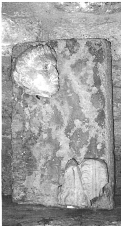
Restes de l'estàtua de sant Esteve de la portalada del monestir de Banyoles. Es conserva en el MACB.

blement un llibre. El cap, en posició reclinada i esbiaixada, mostra la típica tonsura que li retalla els cabells. D'aquesta estàtua conservem dos fragments en el Museu Arqueològic Comarcal de Banyoles: el cap i la part inferior de la túnica. També es conserva el seu pedestal de motlures. Concretament aquest té un escut heràldic sostingut per dos homes barbats descalços amb vestits de tipus militar. En el seu centre hi apareix figurat un lleó sense ales i en la seva part superior hi trobem indicis d'un possible bàcul.