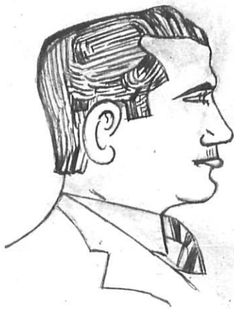
La caricatura era una especialitat molt cultivada per Mir.