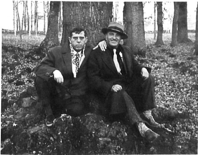
Mir en el paisatge de la Garrotxa.