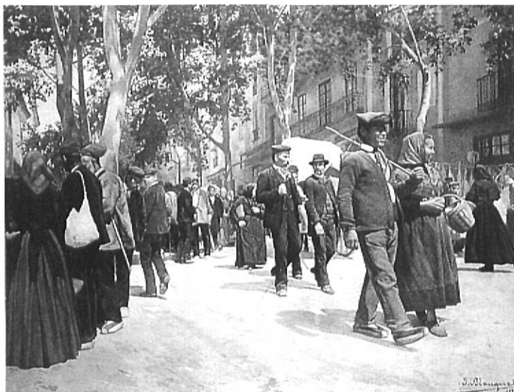
A sota, Pujada del Castell (1899) de Josep Blanquet, és un oli executat a partir d'una fotografia de l'Àlbum Rubaudonadeu que va il·lustrar la portada del núm. 162 de la Revista de Girona .

Estructurada a partir d'un fil conductor cronològic i estilístic, l'exposició reuneix cent trenta-quatre obres de fins a setanta-quatre artistes diferents que, d'una manera o altra, es mouen al voltant de Figueres o de Cadaqués. Lluny d'acabar essent un calaix de sastre on s'han fet cabre obres i autors que només comparteixen el fet de viure o passar èpoques a l'Empordà, els organitzadors aconsegueixen fer evident que,