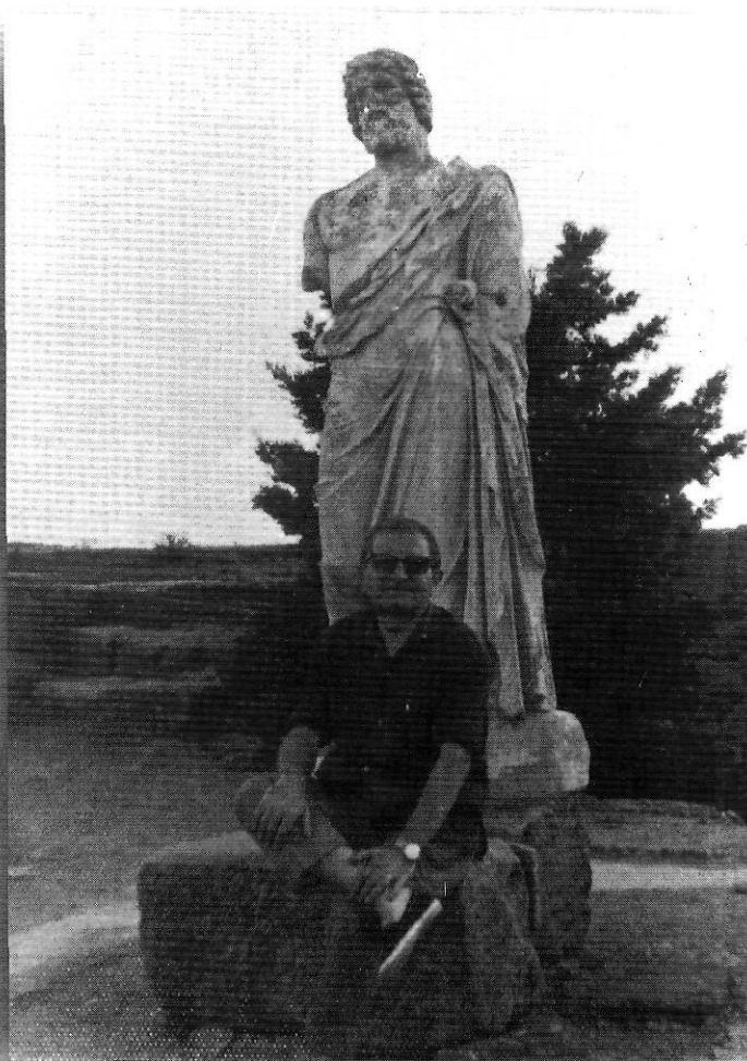
L'historiador Reglà en un escenari històric: les ruïnes d'Empúries.

destriable de la Catalunya dels Àustries? Per a Vicens, aquest bandolerisme és, en realitat, la manifestació més genuïna del gangrenament d'una societat sense il·lusions ,