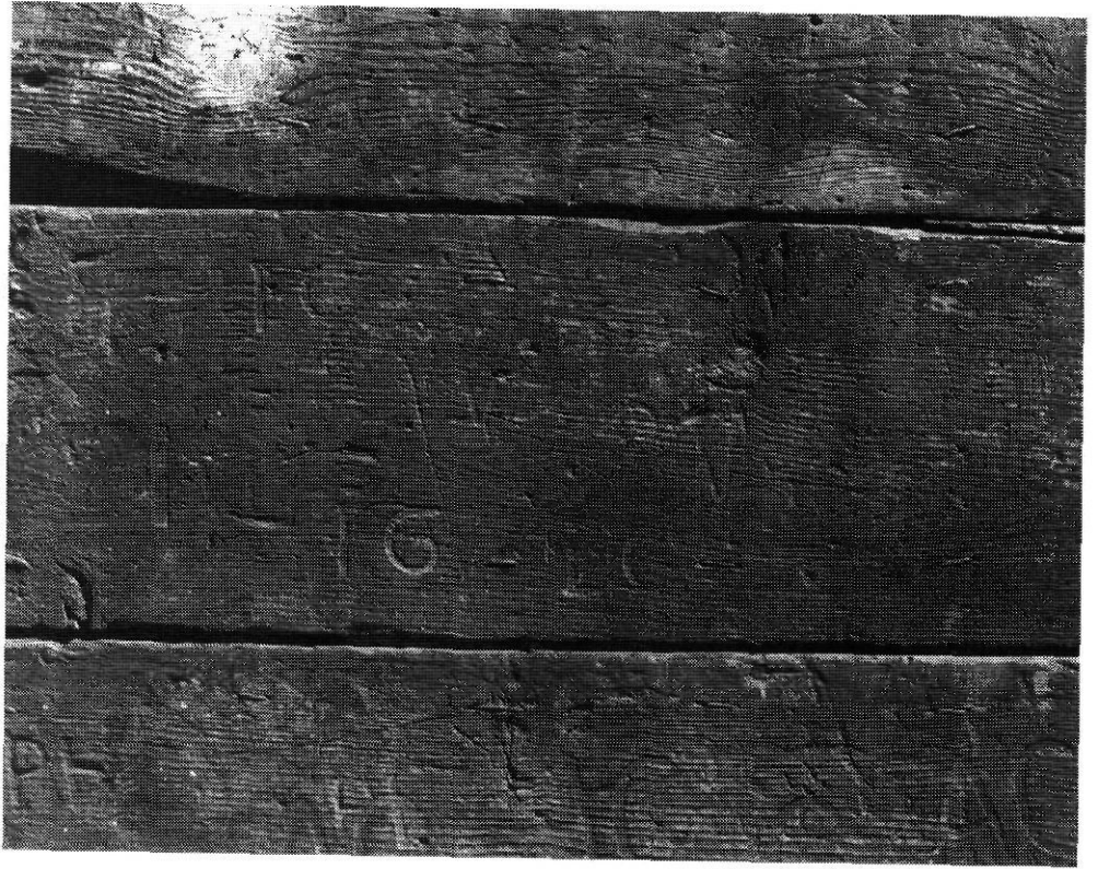
El ferrer d'Alp va anar marcant l'interior de la porta del seu taller amb totes les marques que va anar fent.