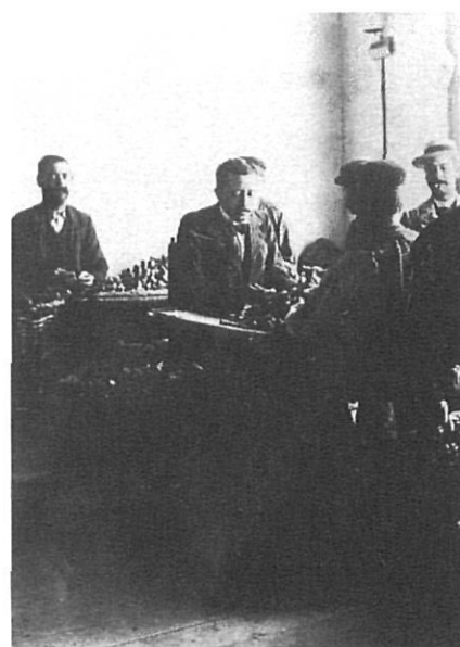
Un obrador de tapers.

A Palamós s'editaren, el 1891 El Eco de la Redención , «òrgano de la Logia Masónica del Gran Oriente Español», La Labor Corchera (1892), el setmanari català La Senyera (1898), i La Redención Obrera (1900-1937), el segon i el quart, periòdics defensors dels obrers suro-tapers.