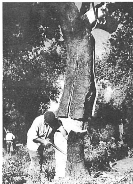
La lleva del suro.

Capçaleres de la premsa palafrugellenca.