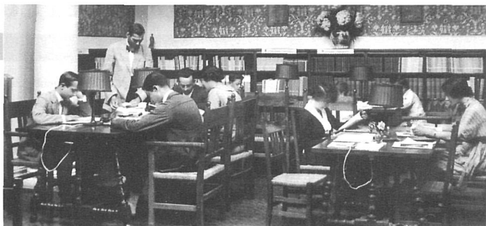
La sala de lectura de la biblioteca d'Olot, en la seva seu noucentista inicial.

El conveni signat l'any 1987, pel qual es creava la Biblioteca Marià Vayreda com a resultat de la fusió de les dues biblioteques olotines, ha estat també objecte de controvèrsia. Sectors propers al Patronat d'Estudis Històrics van mostrar les seves reticències a la integració de la col·lecció local a la Biblioteca Marià Vayreda —argumentant, per exemple, la difícil convivència de la investigació amb la consulta infantil—, van discutir l'elecció del nom del nou centre i van criticar la situació de provisionalitat en què restarien alguns dels fons de l'antiga Biblioteca Municipal que, per