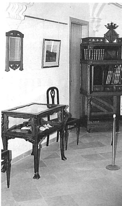
Un aspecte de l'exposició muntada a l'antic convent benedictí.

En aquest context, no cal dir que el republicanisme federal, amb el suport obrer en les eleccions, dominà el poder polític local pràcticament sempre. Federalistes i anarco-col·lectivistes tenien els mateixos espais socials.