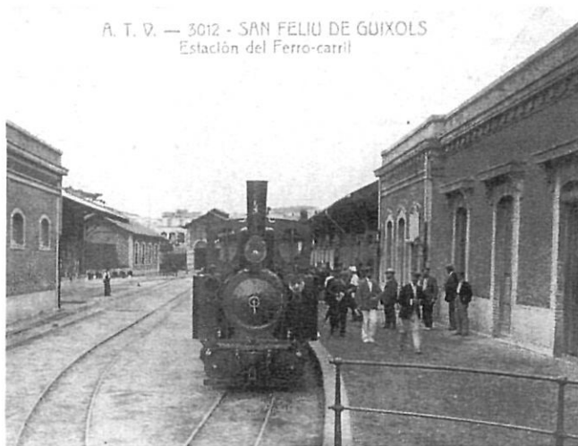
El tren, peça clau de l'època industrial.