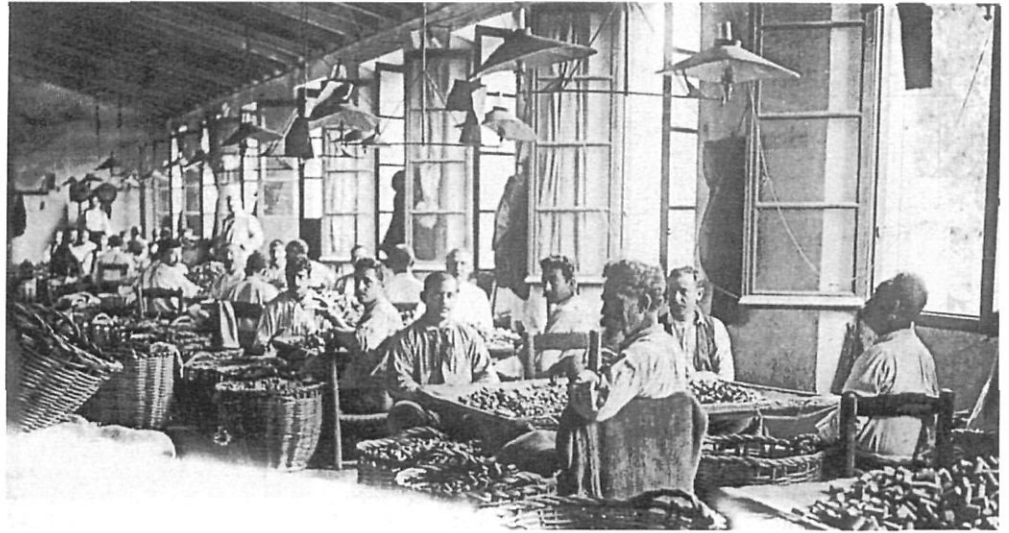
Una imatge característica de la indústria surera a Sant Feliu de Guíxols. A l'altra pàgina, dos anuncis típics de productes guixolencs.