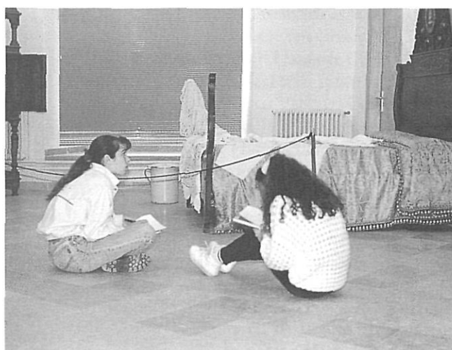
Un objectiu de la mostra era el de desvetllar la curiositat innata dels alumnes.