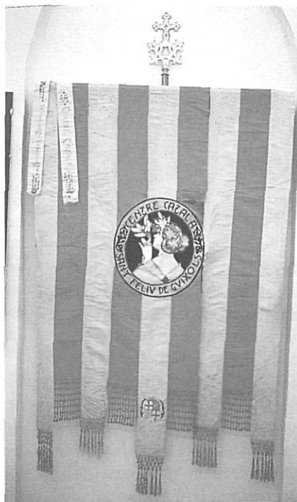
La bandera del Centre Català, de 1900, exhibida a l'exposició.

L'avaluació que n'hem fet, doncs, és molt positiva i satisfactòria, tant des del punt de vista quantitatiu (pel nombre de visitants: 1.042 alumnes d'EGB i dels instituts, i unes 5.000 persones adultes), i també del qualitatiu.