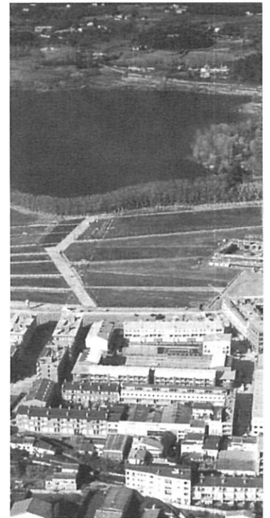
Vista aèria del parc de la Draga.

Per iniciativa dels bisbats de banda i banda del Pirineu es va voler fer un acte de sentit europeista. Com va escriure el bisbe Jaume: «Si els homes i dones de la política i de l'economia suprimeixen duanes cercant concurrències per objectius comuns, per què no hem de cercar cruïlles on trobar-nos els portadors de l'Evangelí?». El nostre