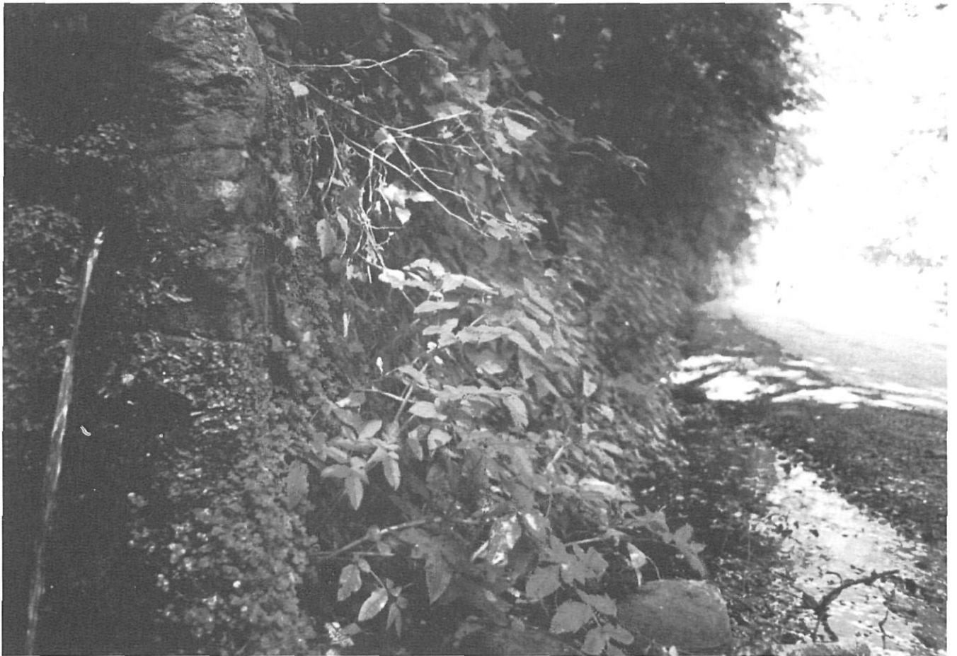
La font del Coral, al peu de la carretera.

temps de les mines era impossible de buscar-ne, no n'hi havia ni un.