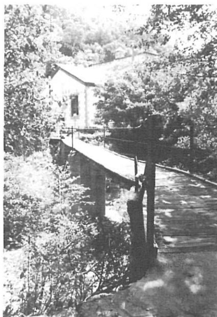
La central d'en Fariás.

cercar l'aigua com més amunt més clara, freda i neta.