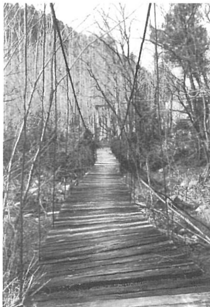
El pont Penjat.

Ara fa uns 15 anys que les mines van tancar i l'aigua tornà a ser neta, clara i quasi transparent. Tornen a viure-hi peixos, libèl·lules i calabotins; en