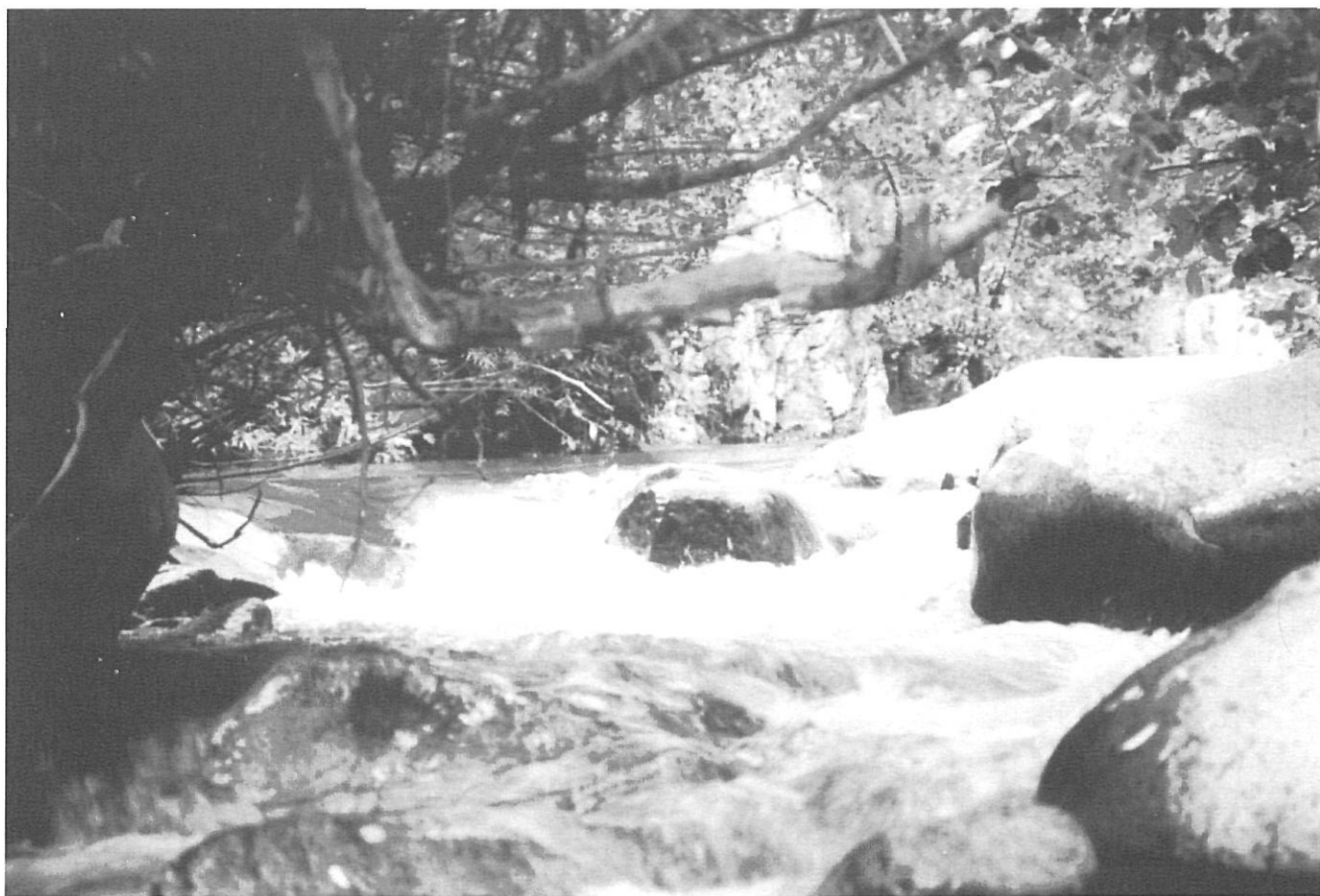
Roques immenses al mig del llit fluvial.

anar-te'n. Els versos que inspiraren Maragall a la Fageda d'en Jordà no tindrien sentit en aquest indret: