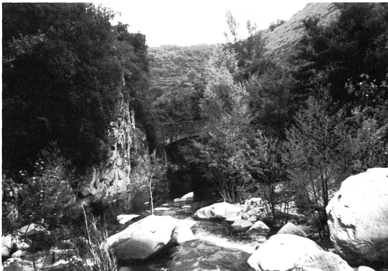
En el tram entre Osor i Anglès hi ha molts ponts.

s'atreveixin a passar-hi, ja que el mal estat de conservació del pont fa que només els més agosarats intentin de creuar-hi les aigües de la riera.