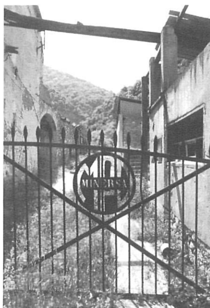
Les mines d'Osor

Tenir una finestra o un balcó que doni a la riera es veu que és molt temptador de llençar-hi objectes: més d'un ha aprofitat una rierada per llençar des de casa noses i trastos vells. És força desolador, quan les aigües ja s'han calmat, d'anar resseguint la riera i trobar peces de roba, sabates o rodes de cotxe com a penyores de deixadesa. M'agradaria pen-