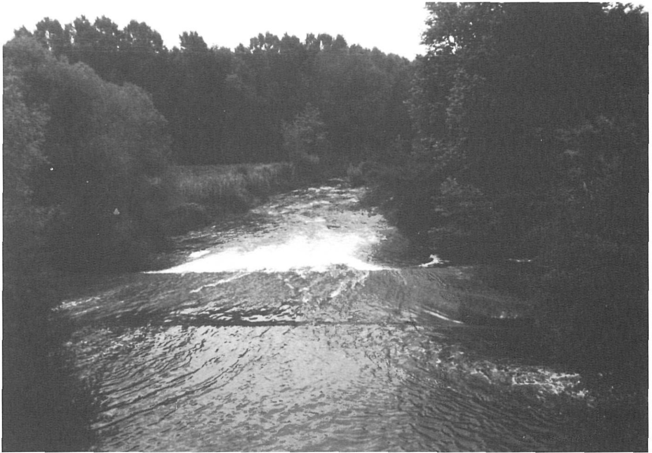
Desembocadura de la riera d'Osor.

la riera d'Osor que no pas la del Ter, tot i que el Ter passa ben a prop d'aquests municipis, però queda massa avall per poder ser aprofitat per al regatge dels camps de la plana.