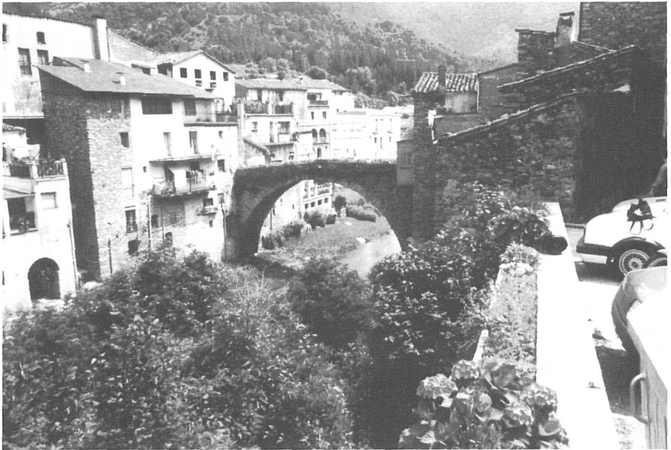
La vila d'Osor.

sar que a hores d'ara ja s'ha perdut aquest mal costum.