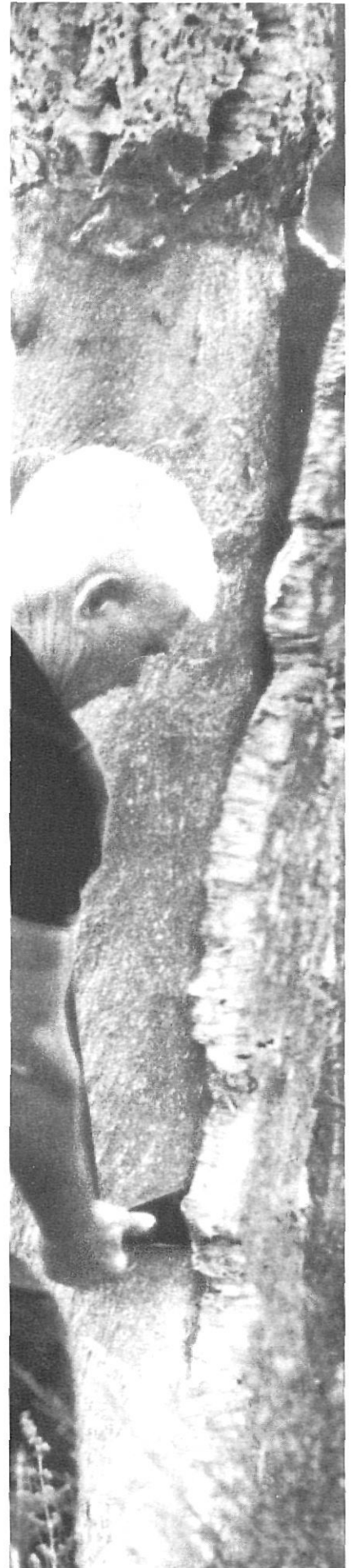
ESTEVE SABENCH - A.I.M.S.

Abans de l'inici de les operacions de la lleva autoritzada, s'haurà de netejar de matolls una superfície al voltant de la planta compresa en un cercle d'un a dos metres de radi.