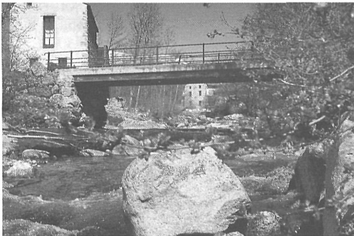
El riu a la Vinyola, prop del pas del canal de Ger

En relació a la constitució del sòl que serveix de llera al nostre riu, podem dir que des del seu naixement fins a Porté trobem esquistos; després, i fins a Quers, tenim terrenys de formació glacial alternant amb granit, i continua finalment, sobre terrenys d'al·luvions.