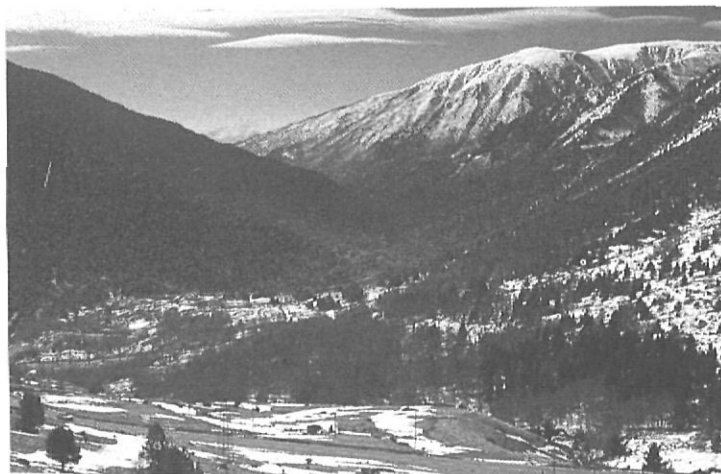
La capçalera de la vall del Querol, des de Fontviva.

local. Abans del naixement del poble però, possiblement ja existia l'anomenada «Torre Cerdana», fortificació que prengué més relleu per la seva estratègica situació que per la capacitat potencial de defensa i acolliment de la població. Hom creu que és del segle IX però, ni les fonts literàries ni els testimonis arqueològics constaten una utilització anterior al segle XIII; va ser destruïda successives vegades, essent la darrera el 1660. Al peu d'aquesta, el riu s'engorja puntualment fins a arribar a Porta, poble documentat des del segle XI, quan part dels seus terrenys pertanyien al monestir de Sant Llorenç prop de Bagà, a l'actual Berguedà. D'antuvi, basà part de la seva economia en la producció de farina, a partir de l'aprofitament del riu, que pren ací les aigües del torrent del Campquerdós i un xic més avall també les dels torrents de Malforat i de Tarters.