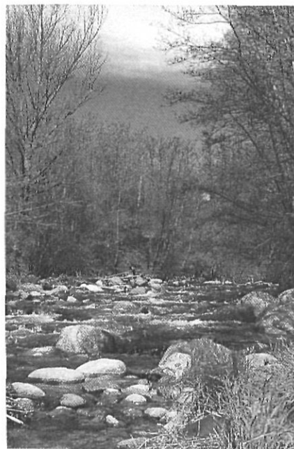
Exemple de vegetació de ribera al curs baix del riu.

Els rius no entenen de fronteres però, alguns homes s'esforcen per tal de tenir-les ben presents; ara, ja en terres espanyoles, les seves aigües flueixen, tot regant els camps i les pastures de Saneja i Puigcerdà, obrint-se pas entre els bastions naturals del puig de Saneja i del mont Cerdà. Al peu d'aquest darrer, l'Aravó passa, solemne, per sota del pont de Sant Martí, esplèndida mostra d'arquitectura civil del segle XIV; malauradament, el trànsit rodat desdibuixa, tot sovint, la seva vistositat. Ben endinsat a la plana, el riu corre paral·lel a l'antiga «Strata Ceretana» dels romans, anant a morir al lloc dit del Soler —parròquia medieval de Sant Climent del Soler— tot vessant les seves aigües al Segre. Abans però, rega encara les rodalies dels nuclis de Ventajola —on es conserva una portalada romànica procedent del santuari de Quadres (Isòvol)— i de Tallorta, dues gracioses pinzellades de gris en un immens mar verd.