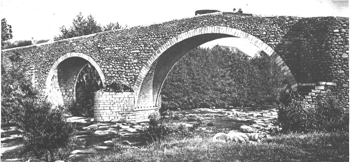
L'Aravó sota el pont de Sant Martí, al principi d'aquest segle.

Aparentment, va néixer a partir del castell de Querol, prenent-li protagonisme amb el temps, si bé des del segle XIII va anar perdent importància política en favor de la nova plaça de Puigcerdà (fundada el 1177). Al seu entorn, inscultures prehistòriques fan referència a rituals desconeguts, i grafitis ibèrics i medievals són testimoni de la vida pretèrita de les seves gents. Altres documents valuosos són els exemples d'art renaixentista i barroc conservats. El viatger pot aprofitar la possibilitat de prendre aquí, el «trenet groc» que li permetrà de gaudir d'un singular paisatge, tot remuntant la Cerdanya a una velocitat còmoda fins arribar al bell enclavament de Vilafranca, ja al Conflent.