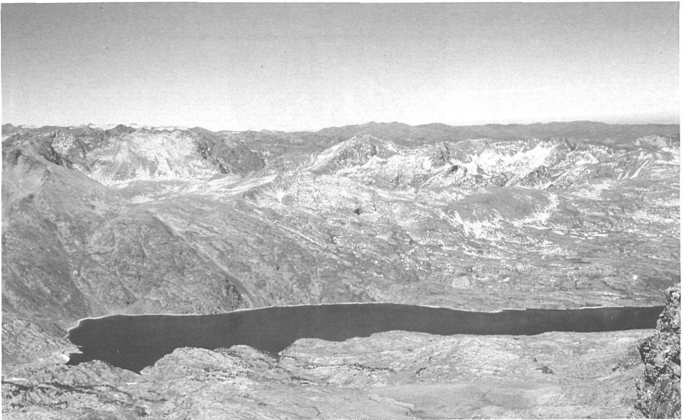
L'estany de Lanós voltat pel massís del Carlit, a l'estiu.

ventós, fred i nivós, bressol de la cèlebre «rufaca». Actualment, part de les aigües de Lanós corren cap a l'Arija i, a canvi, la Cerdanya rep altres procedents d'allà; el fet, que ens sembla ara curiós, va ser fortament debatut a la primeria d'aquest segle. Al llarg dels seus 30 km de recorregut el Querol recull el cabal de diversos torrents; com a afluents, per la riba dreta hi aboquen les aigües el torrent de la Vinyola, damunt de Porté; la derivació del riu Arija, que pel canal Verdier rep aigües que d'altra manera farien cap a l'Atlàntic, sortint aquestes, abans del túnel ferroviari del Pimorent. L'empremta humana es presenta aquí, sota formes diverses: cabana del pescador de truites, cabana de pastor, gravats rupestres, etc. ja que els recursos que ofereix el lloc són diversos i variats. Així doncs, les pastures d'estiu, abundoses, han estat des de sempre molt freqüentades.