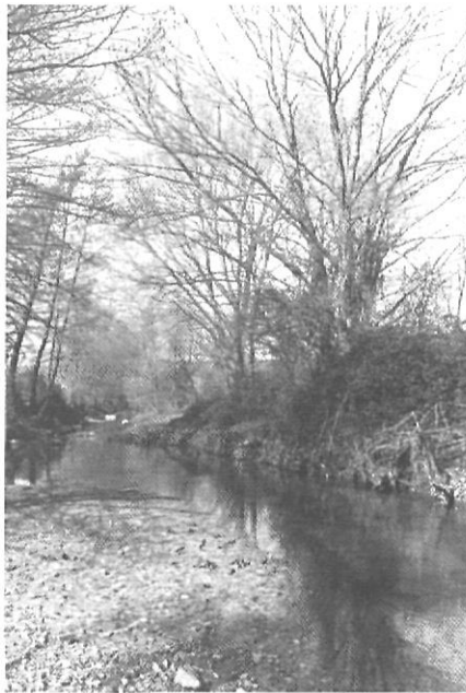
«El record de l'Onyar utilitzat per banyar-s'hi, beure-hi o pescar és molt recent encara»

Si l'Onyar tingués una llegenda d'aquestes de llibre, amb dones d'aigua o bruixes dels gorgs, ben segur que s'hagués originat pels voltants de la resclosa de can Borra o més amunt i tot, prop del seu naixement. Però ni les persones més grans i arrelades a la contrada ni els llibres d'històries i llegendes no saben res del tema, com si tot l'anecdota del riu es reduís a les seves