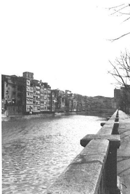
«Llevat del dia que plou una mica més del compte, a Girona l'Onyar és tranquil»

vessa, i ens passem més estones destriant els colors de les façanes que s'hi emmirallen i apartant-nos dels objectius fotogràfics dels turistes que l'empresonen des dels ponts que no pas tenint-li por. Llevat del dia que plou una mica més del compte i del vespre que clou les Fires, quan tot Girona és a la plaça Catalunya mirant el cel encès, l'Onyar és tranquil. I si parlo del dia dels focs és perquè m'impresiona aquella mica d'esquerda que es va obrint de tant en tant a l'asfalt del cobrellit del riu, com una punta de rebel·lió. I el dia dels focs m'hi fixo més i hi penso més, també. Però, després, ja no tant. I, normalment, m'agrada travessar la plaça Catalunya per la part de les baranes i, amb les claus, fer teclejar el ferro. Pel pont de Pedra hi passo poc perquè és massa alt i no veig bé l'aigua de sota. Del de les Peixateries