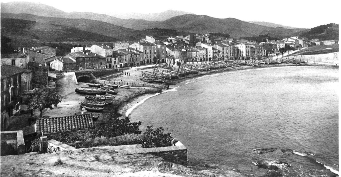
Cervera de la Marenda, a la vora de la Mediterrània

Deixant a part la Presentació i els preàmbuls, a l'Atlas s'hi distingeixen de forma clara una part central (de 80 pàgines), una justificació de l'àmbit delimi-