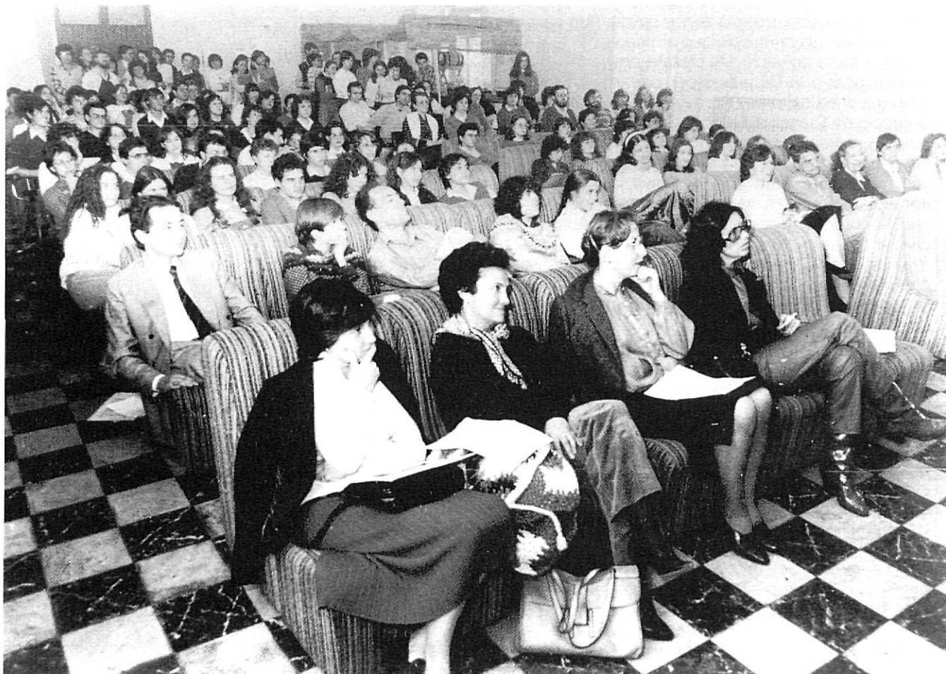
Assistents al primer certamen poètic de llatí.

Els centres universitaris gironins van iniciar una nova batalla enmig d'aquest conflicte: veterinària. L'any 1980, una comissió formada per representants de les institucions polítiques, professionals gironins del sector i universitaris, tant del Col·legi Universitari com de l'Escola Universitària Politècnica de Girona, sol·licità formalment la creació d'una facultat de veterinària a Catalunya i la ubicació a Girona d'aquests estudis. Es redactaren informes, es van fer gestions, es polemitzà amb altres poblacions de Catalunya que també reclamaven veterinària. Al capdavant, la Facultat s'instal·là prop de Barcelona i se'n comunicà que s'organitzaria de manera