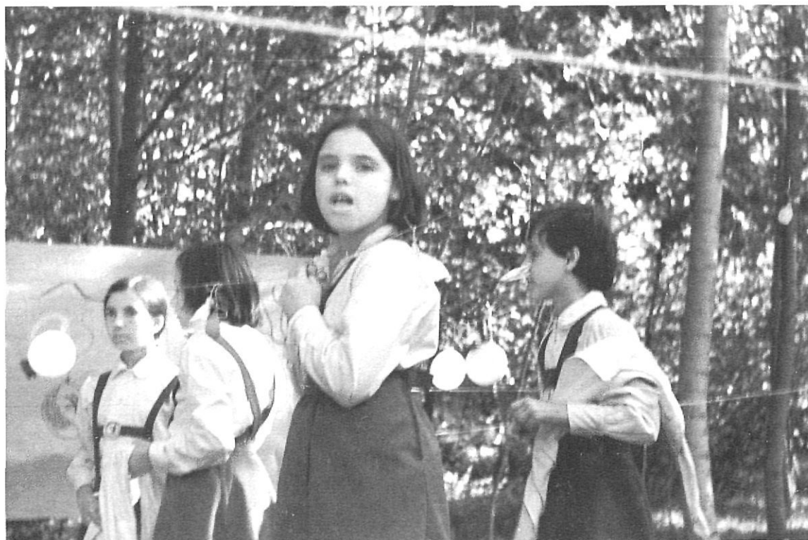
Camp d'estiu a Sant Aniol de Finestres el 1971. Les daines són de l'agrupament de Casa Carles, de Girona.

cién a començaments de segle, aniran in crescendo (amb alts i baixos) i aconseguiran el seu moment àlgid durant la Segona República. La política educativa del govern republicà i de la Generalitat fomentaran la consolidació dels grans corrents pedagògics europeus a casa nostra, fomentaran l'arrelament d'experiències escolars que voldran aplicar els postulats pedagògics de l'Escola Nova: Decroly, Montessori... I no oblidem que un dels punts definitoris del moviment de l'Escola Nova diu que aquesta escola està situada en plena naturalesa, perquè és aquest el medi natural del nen , (de tota manera, afegeix tot seguit, que és aconsellable, de cara a la cultura intel·lectual i artística, no estar massa lluny d'una ciutat).