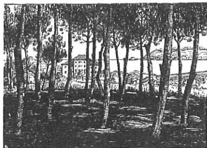
ESCOLA DE S'AGARÓ DENSIONAT DE PRIMER ORDRE

L'Escola de S'Agaró tenia com a fita principal el desenvolupament de la personalitat de l'alumne.