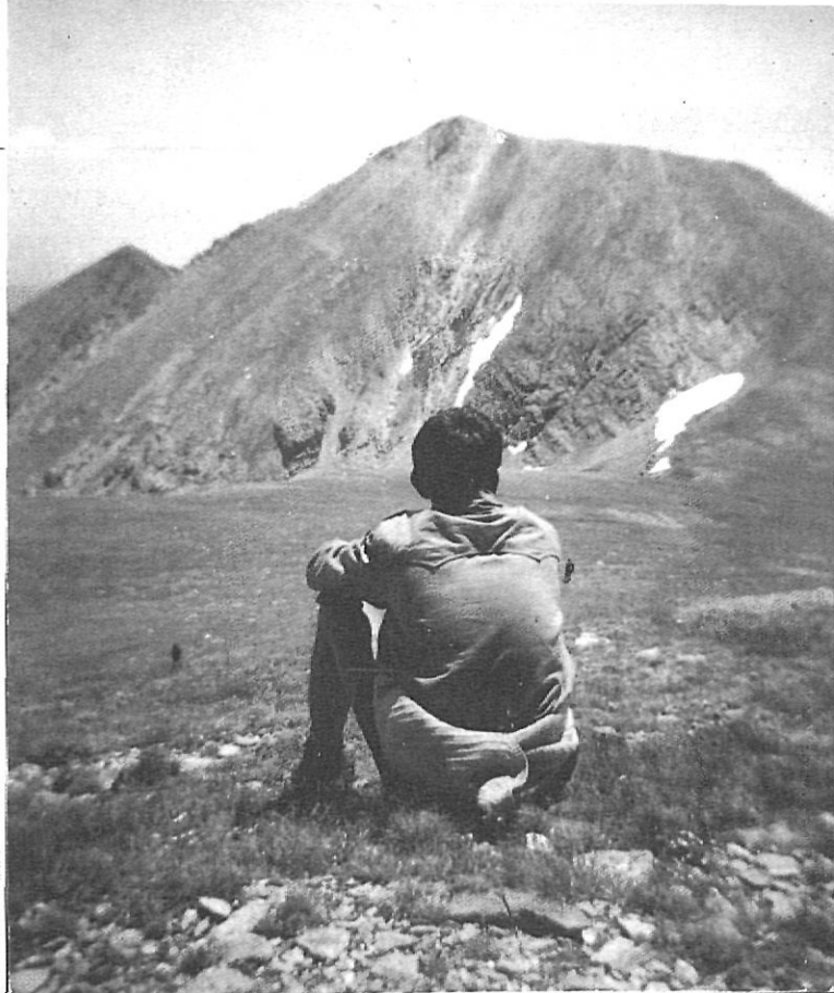
L'escoltisme troba en els Pirineus un escenari adequat per fomentar la solidaritat.

homes que sentin a cada moment la responsabilitat dels seus propis actes davant de Déu i davant de la Pàtria». (N. Masó fou un dels iniciadors d'Unió Democràtica de Catalunya).