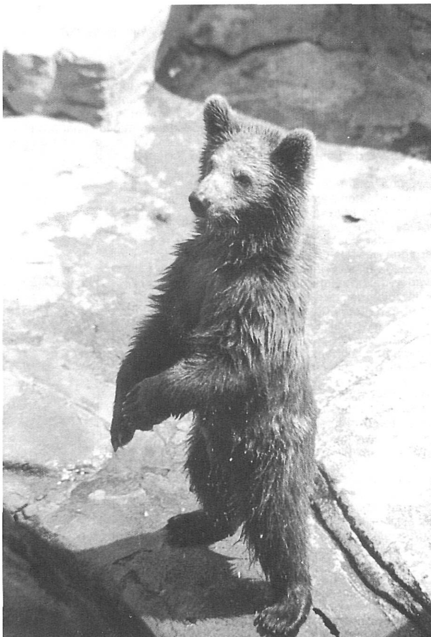
Ben aviat els óssos del Pirineu només els podrem veure al Zoo.

Se suposa que aquestes són les parts més selectes gastronòmicament, i encara el segle passat el cuiner francès dels reis de Rússia