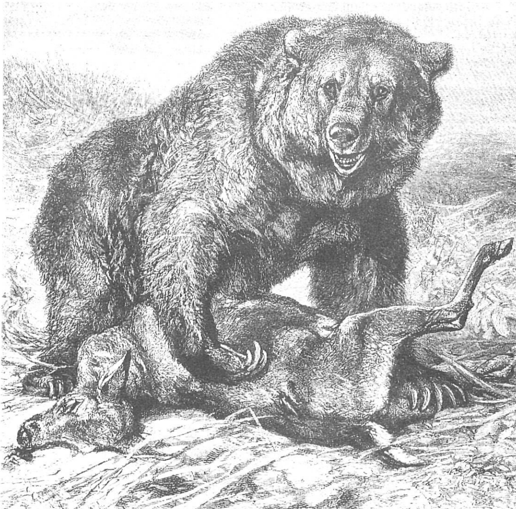
L'Ós no sol atacar mai grans mamífers.