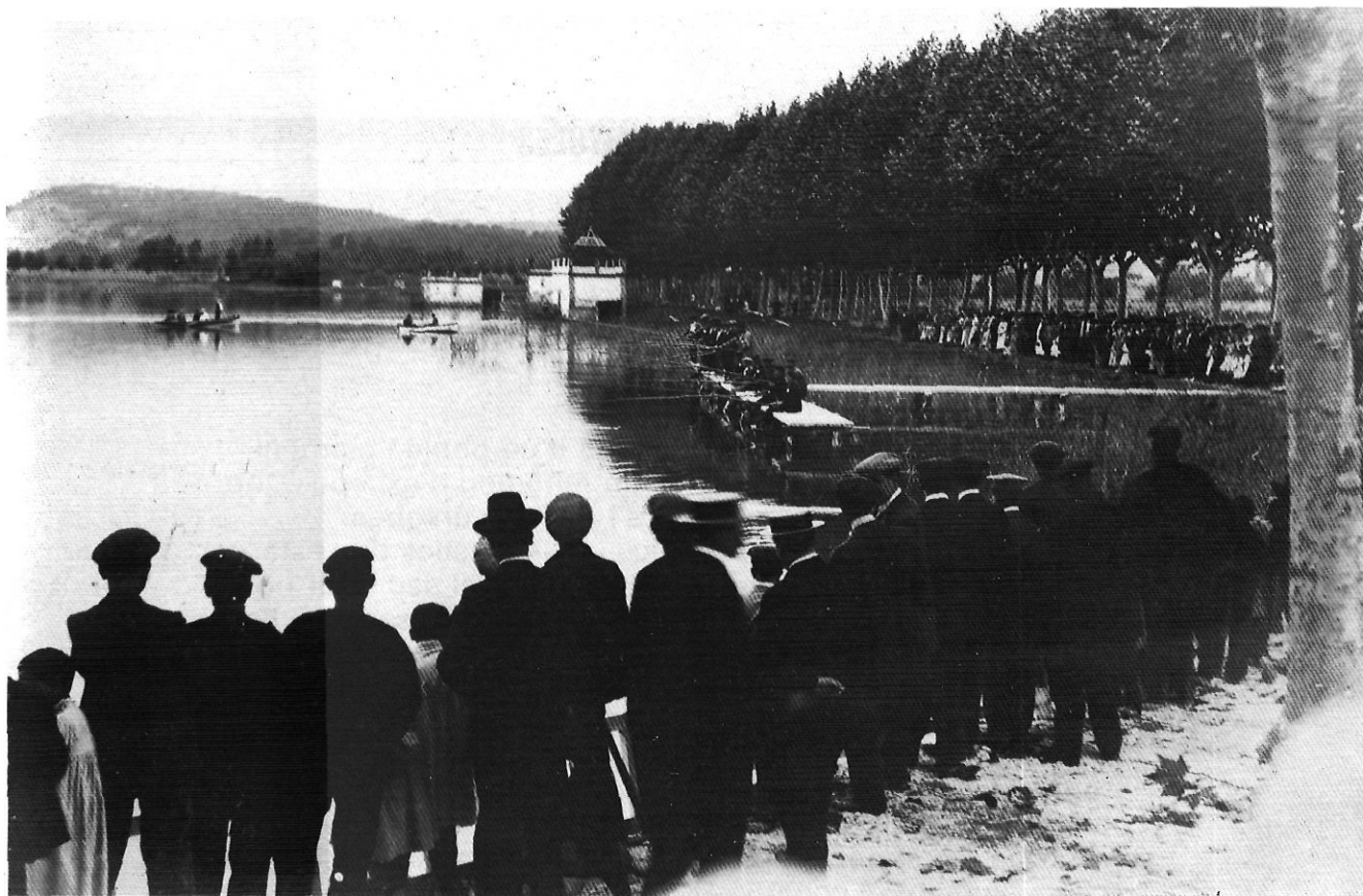
Concurs de pesca a l'estany de Banyoles dintre dels actes de la primera Festa del Peix a l'any 1910.