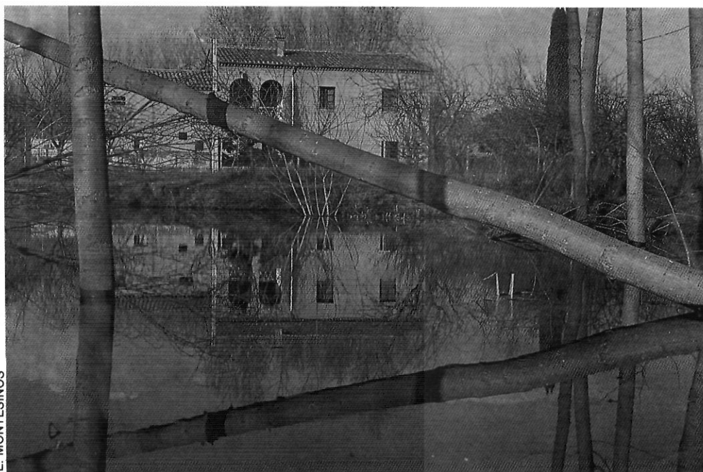
Laboratori Municipal de Limnologia, a Can Sisó, secció del Museu Darder dedicada a l'estudi i divulgació de l'estany de Banyoles.