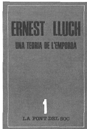
LLUCH, Ernest Una teoria de l'Empordà. Edicions Federals, S.A., 1a. edició, abril de 1987. Figueres. Col.lecció La font del soc, 1, 51 pp.

Proposa aclarir definitivament què hi ha de cert i què de llegendari en les biografies del popular Rector de Vallfogona, i això treballant en dues direccions: per una banda, comprovant la versemblança i l'exactitud de tot allò que s'ha dit fins ara sobre la vida de Garcia; per l'altra, incorporant aquelles notícies noves que una investigació de primera mà anava aportant al seu autor.