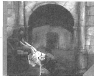
CANAL I MORELL, Jordi Una vila catalana davant la mort, la pesta de 1650 a Olot. Editora de Batet. 1a. edició, març de 1987. Olot, 126 pp.

L'origen d'aquest llibre s'ha de cercar en les reflexions viscudes conjuntament pels autors a l'hora d'afrontar, l'any 1984, l'encàrrec de celebrar a l'estany de Banyoles les proves de rem i piragüisme dels Jocs Olímpics de Barcelona. S'estructura en tres parts, que es dediquen respectivament a l'espai urbanitzat, al fet diferencial que representa l'estany i al desenvolupament econòmic de l'àrea banyolina.