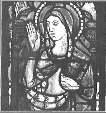
CORPUS VITREARUM MEDIÆVI - ESPANYA, 7 - CATALUNYA, 2

amb les tres plantes de la catedral de Girona aixecades o actualitzades per Antoni Vila i Delclós, hom pot aconseguir un coneixement molt notable dels vitralls medievals de la nostra ciutat.