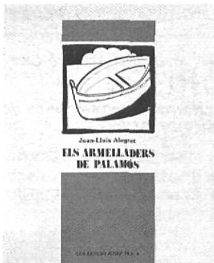
ALEGRET, Joan-Lluís Els armelladers de Palamós. Diputació de Girona. 1a. edició, abril de 1987. Girona. Col.lecció Josep Pla, 4, 253 pp.

L'anàlisi d'una epidèmia concreta de pesta bubònica, la que afectà l'any 1650, entre altres llocs, la vila d'Olot, i tots els aspectes que l'envolten és la que articula l'obra de Canal. En aquesta, a més d'analitzar-se la incidència de la malaltia sobre la població, es tracta també el comportament dels homes de la vila i els esclats de religiositat, el desenvolupament de l'epidèmia, els enterraments o bé la desigualtat social davant la mort. En definitiva l'estudi de l'enfrontament i la convivència d'una vila amb la mort.