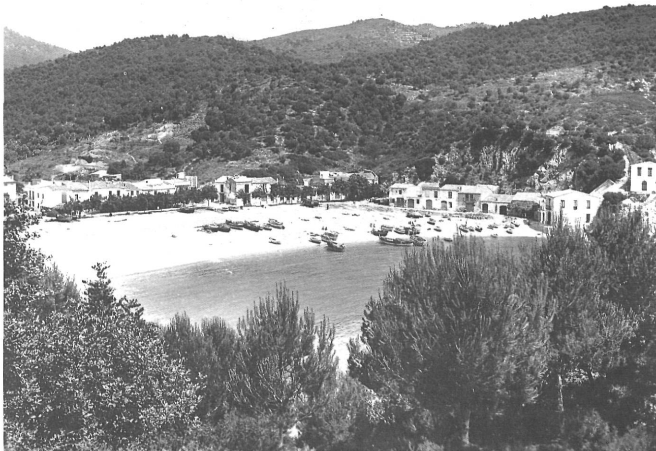
En la immediata postguerra a Tamariu tothom es coneixia i el turisme encara era escàs.

(de Cancionero en una playa , a Cuaderno catalán . Revista de Occidente, Madrid, 1965).