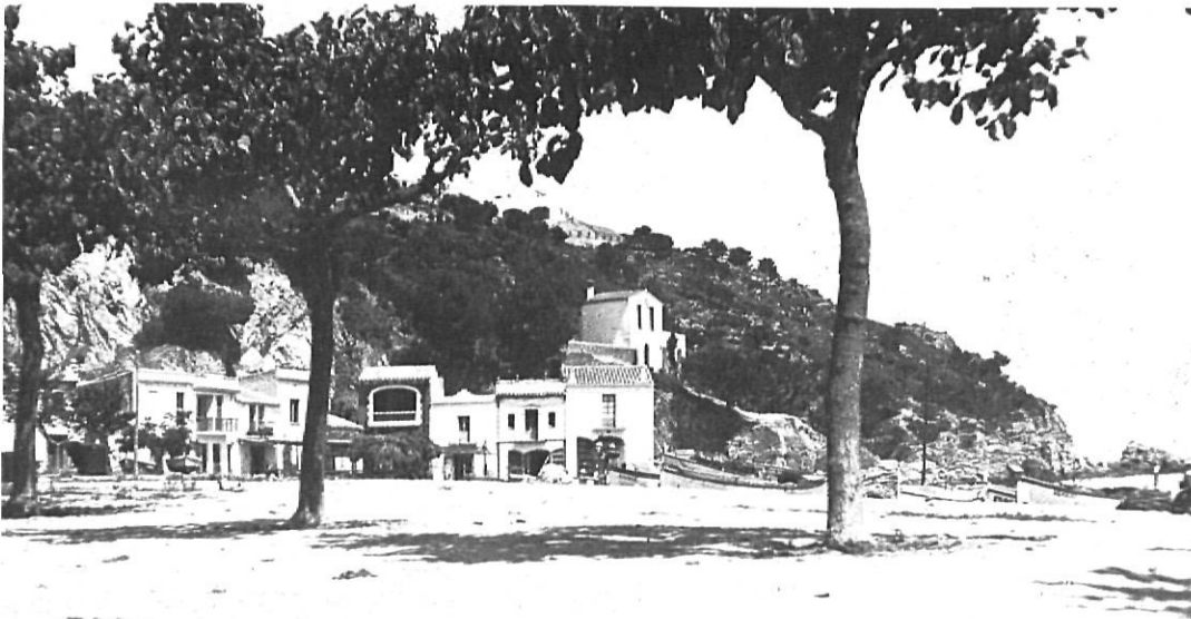
Entre altres llocs de Tamariu, Ridruejo va habitar la finca anomenada "La Perica".

Ja no cal dir que Ridruejo era un home auster i sobri, i que durant les seves estades a Tamariu no va fer mai res per fer-se notar. Ni gestos desorbitats, ni paraules fortes, ni vestits llampants. A l'inrevés de tanta gent, sobretot artistes, que fan els possibles per no passar desapercebuts. Una discreció total. L'havíem vist alguna vegada a Palafrugell amb un cabàs, anant de com-