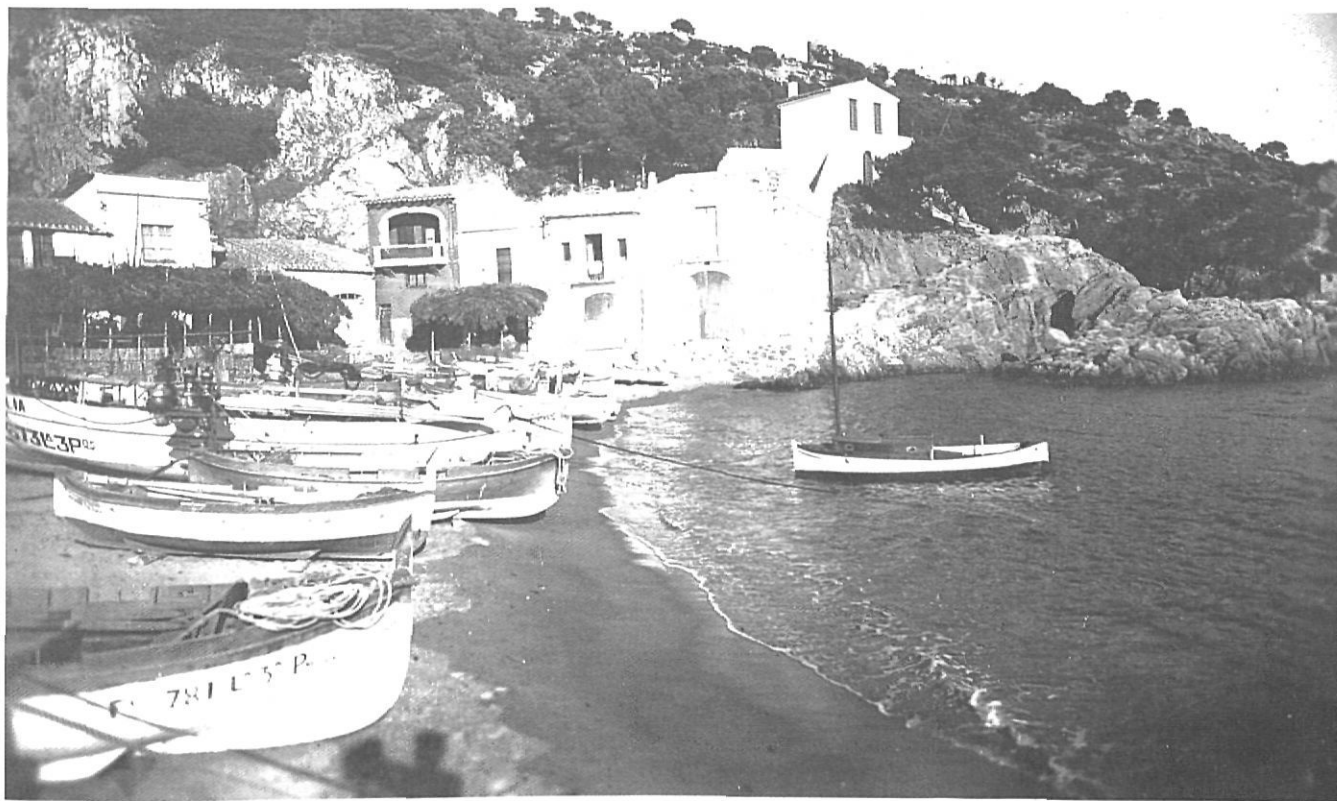
Mentre Dionisio Ridruejo vivia desterrat al Maresme, va passar algunes temporades a Tamariu.