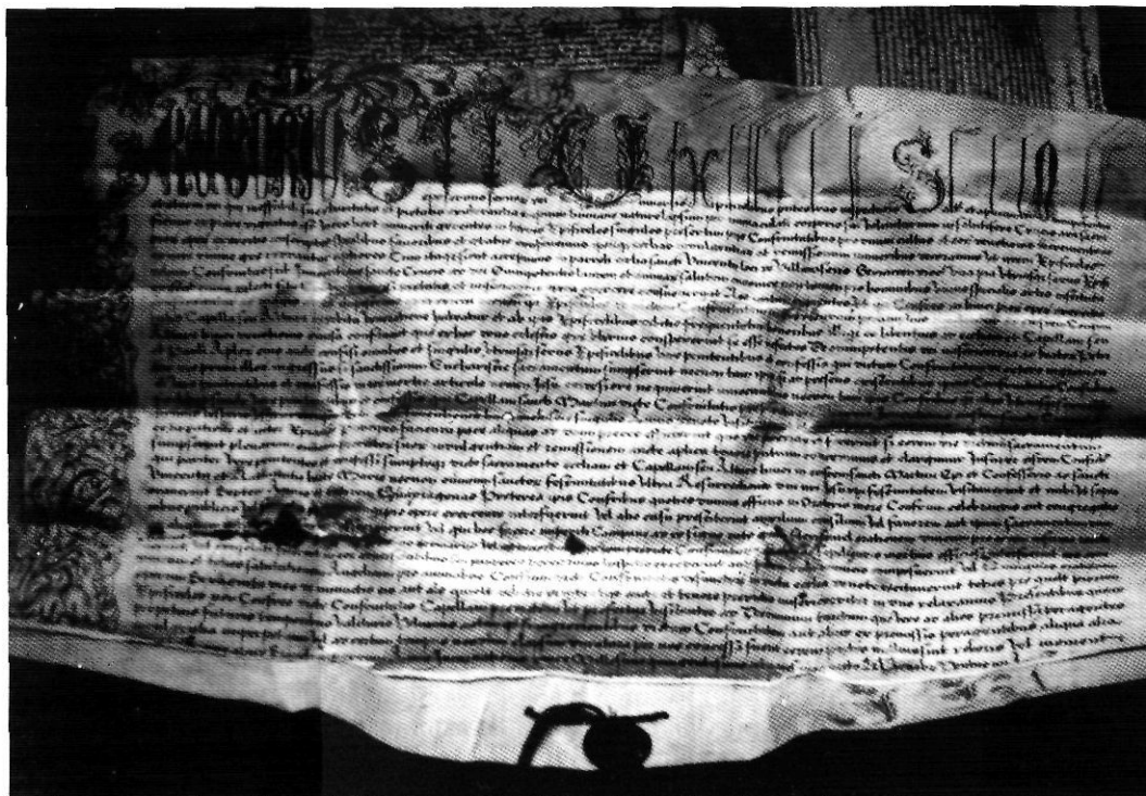
El pergami és el principal suport documental fins a la dècada de 1630-40.

o la seva degradació fos extrema, fins al punt que posés en perill la seva conservació, fet que poques vegades se'ns ha presentat.