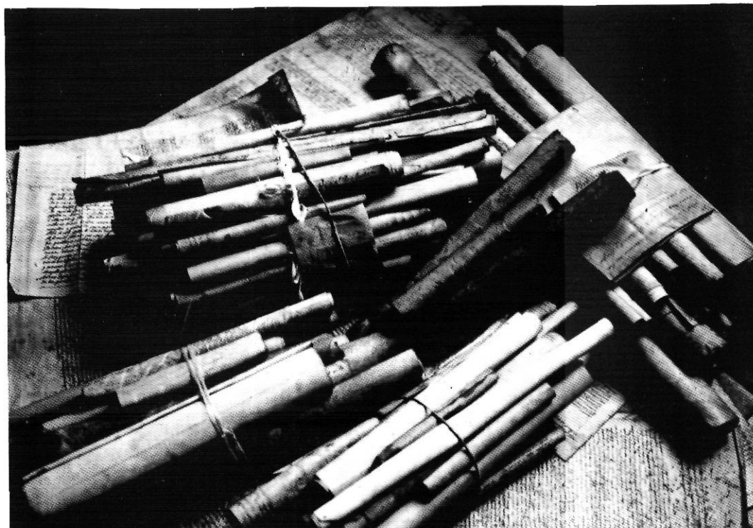
El més freqüent és trobar els pergamins en plects i enrotllats.

En la documentació de tipus feudal incloem tot el referent al domini directe i als drets dominicals que aquest domini comporta en relació amb el patrimoni. La procedència d'aquesta documentació és doble: d'una banda, la generada pel desenvolupament del patrimoni; de l'altra, la que és resultat de l'arrendament del cobrament de drets feudals o de l'exercici de càrrecs relacionats amb el senyoriu.