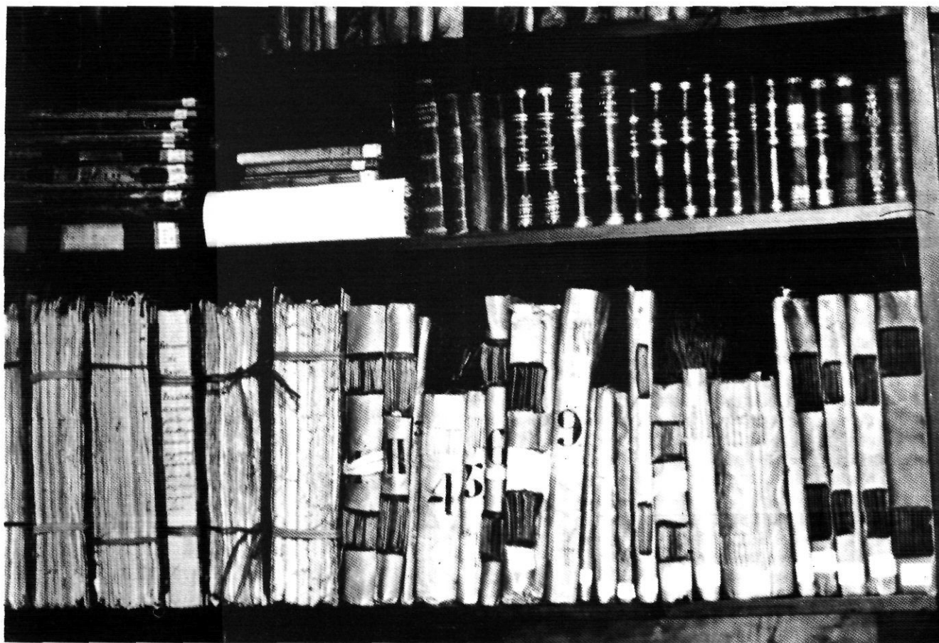
La documentació acostuma a estar dipositada a la biblioteca familiar...