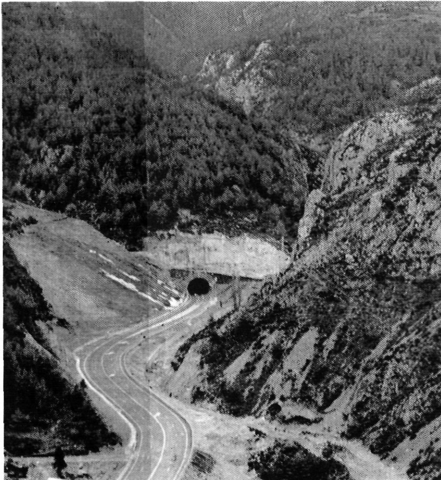
Túnel del Cadí. La millora de l'accessibilitat ha afavorit el turisme de muntanya.

A més, en la perspectiva de frenar la regressió demogràfica en aquestes zones —més encara en aquelles on predominen les activitats agrícoles o ramaderes, que són precisament les més amenaçades per la pèrdua de població—, cal no