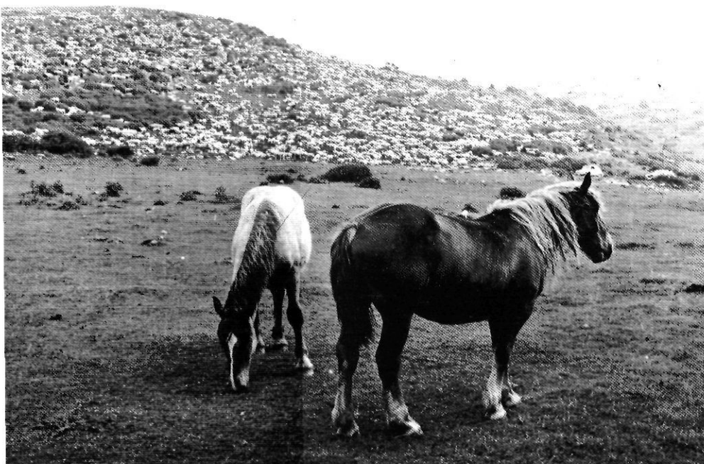
El bestiar permet fer ús d'extenses pastures de muntanya.

El tipus més significatiu és el de les explotacions petites productores de mercaderies (PPM) , on la característica bàsica és la capacitat de renovació dels mitjans de producció d'acord amb els imperatius