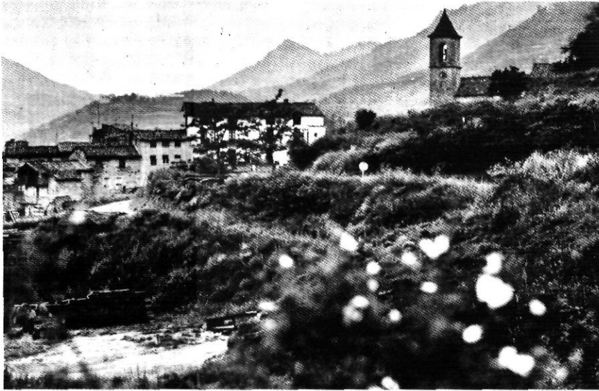
Gombren, un poble antic, un terreny accidentat.

producció d'aquestes explotacions i la part limitada dels factors de producció, a preus actualitzats, que li permet reemplaçar les seves estructures per a ésser competitives en el mercat, en no comptabilitzar part dels factors esmentats. Si es fa una projecció d'aquests resultats en el territori obtindrem un benefici social en termes d'activitat econòmica, demogràfica i d'ús del sòl,