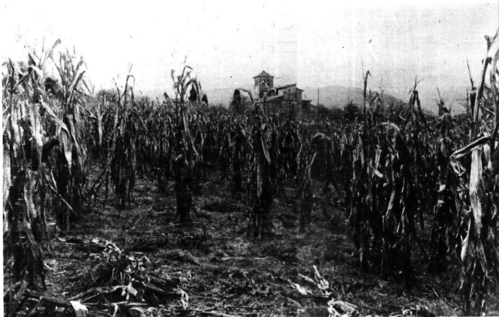
La Vall de Bianya. Les activitats agràries són complementàries d'altres formes d'ingressos.

En conclusió, doncs, hom pot afirmar que l'agricultura de muntanya obté un òptim amb les PPM, ja que el seu nivell de productivitat expressa la relació entre el valor de