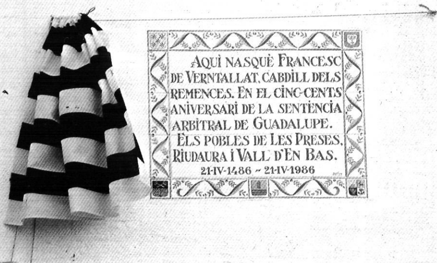
Inauguració d'una placa commemorativa en el Mas Verntallat (les Preses) el dia 20 d'abril del 1986.

Tot i amb això, els esforços que s'han fet des d'Olot a la Bisbal o des d'Olot a Amer són valuosos, perquè dubtem també que les institucions s'haguessin decidit a abordar el tema sense l'existència d'una inquietud popular, la mateixa que, neguitejada per la situació política actual, s'acosta a la història local perquè continua volent saber, comprendre i transformar. Benvinguts siguin, doncs, tots els esforços de la història local i els esforços del Centre d'Estudis Remences, ja que si més no, la seva existència suposa el reconeixement que encara hi ha moltes lectures històriques a fer i que no hi ha conclusions definitives sobre el tema. El plet remença continua sent —i això és bo— un debat obert.