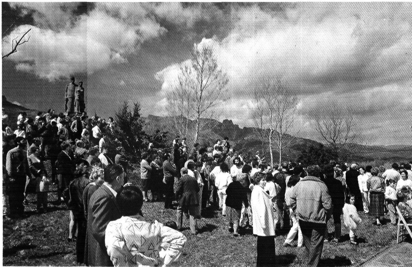
Monument als pagesos aixecat a la Vall de Bas amb motiu de la commemoració del 500è aniversari de la sentència de Guadalupe.