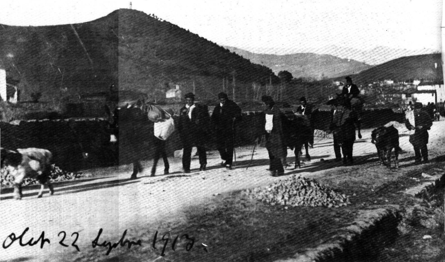
La segona pregunta de la Ponència deia: "a quin mercat aneu?". A la fotografia, tornada del Mercat d'Olot el dia 22 de setembre de 1913.