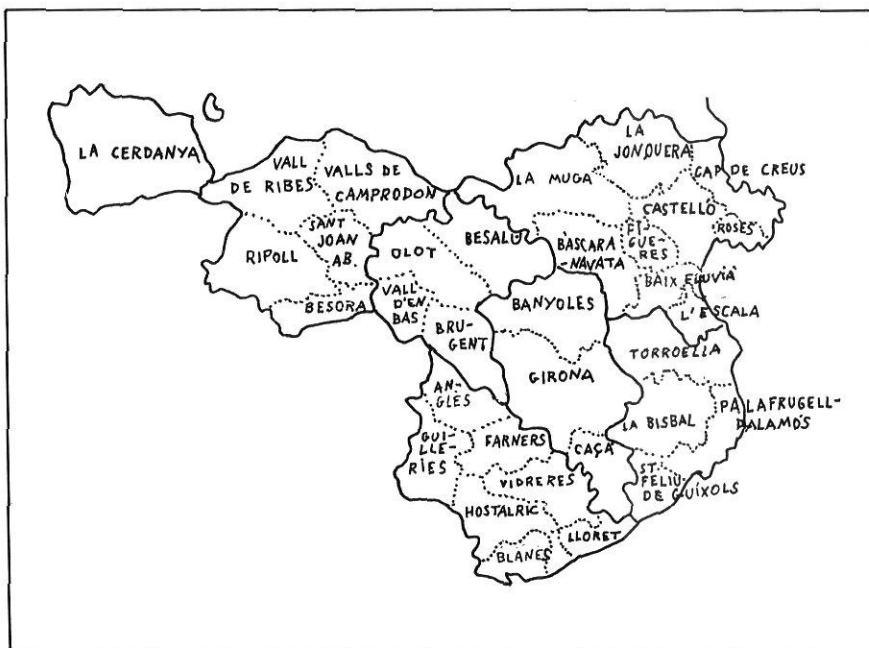
El sector gironí, segons la proposta d'organització territorial de l'autor.

S'ha d'admetre que l'estudi de R. Serra no mena a cap solució dels problemes plantejats avui, possiblement perquè no distingeix entre el que són qüestions privatives de l'Administració Central de la Generalitat i les que ho són de l'Administració Local, i perquè es reclou en una visió tradicional de la comarca que no encaixa ni amb la realitat actual ni amb els desigs manifestats repetidament per la població de Catalunya de veure reconeguts tant els seus drets a la participació en els afers públics, com els instruments que l'hagin de permetre amb eficàcia, amb un efectiu control i sense encariments evitables. A més, en la rodalia, que perpetuaria el paper dominant d'una població centre unificador (tal com ha anat passant fins ara), amb tota la conseqüent pèrdua de personalitat del que és sotmès, no hi ha instruments de cap tipus que permetin frenar el paper expansiu de les corporacions més poderoses. Precisament, aquesta situació és la que es proposa evitar la institucionalització de la municipalia, en què tots els