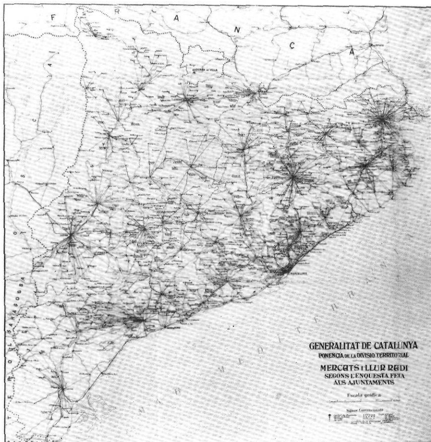
El mapa indica els mercats i llur radi segons les respostes dels Ajuntaments.