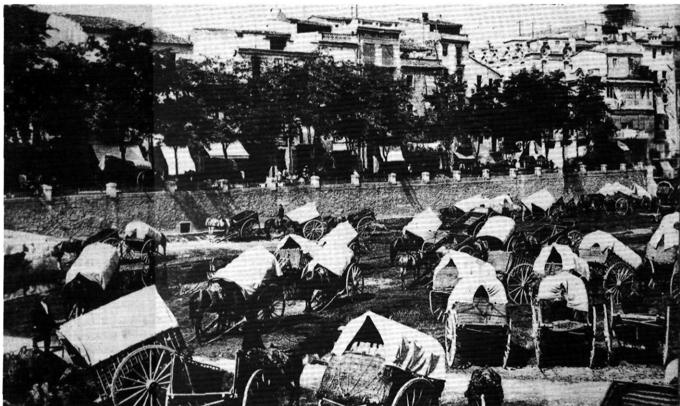
Els mercats designats pels Ajuntaments havien arrelat profundament en les respectives contrades. A la fotografia, el de Girona a l'arenys de l'Onyar.

Però, cada vegada més, s'ha pogut comprovar que l'assistència a un mercat no és del tot significativa i que existeixen tot un feix de relacions que indiquen molt més la pertinença a un cercle territorial determinat que no ho fan les compres al mercat setmanal. Són les relacions de base diària efectuades en funció del treball, de la cultura, del comerç.