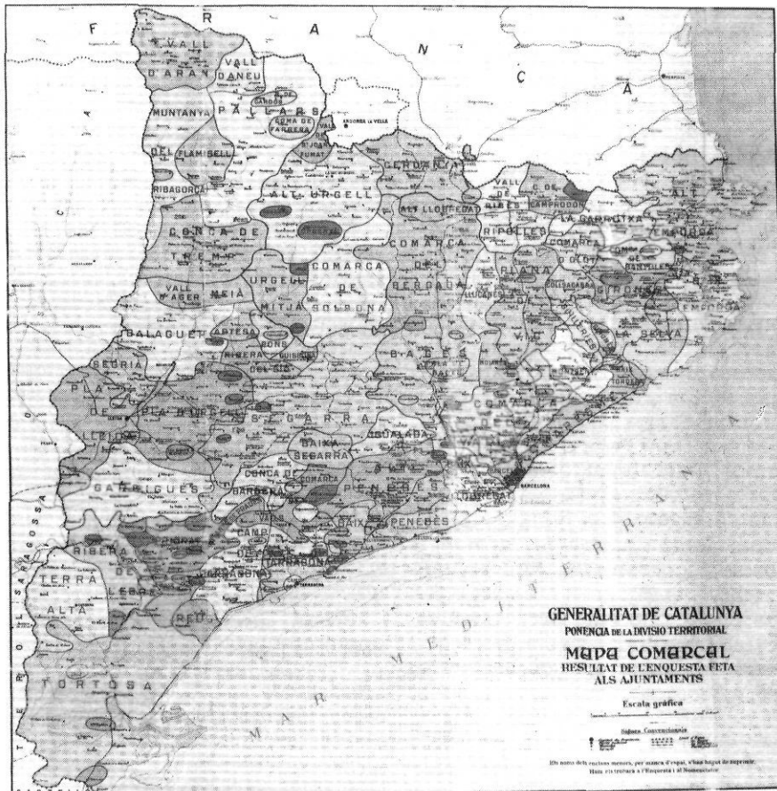
El mapa reflecteix les respostes municipals a la pregunta "a quina comarca creieu que pertany el vostre poble?".