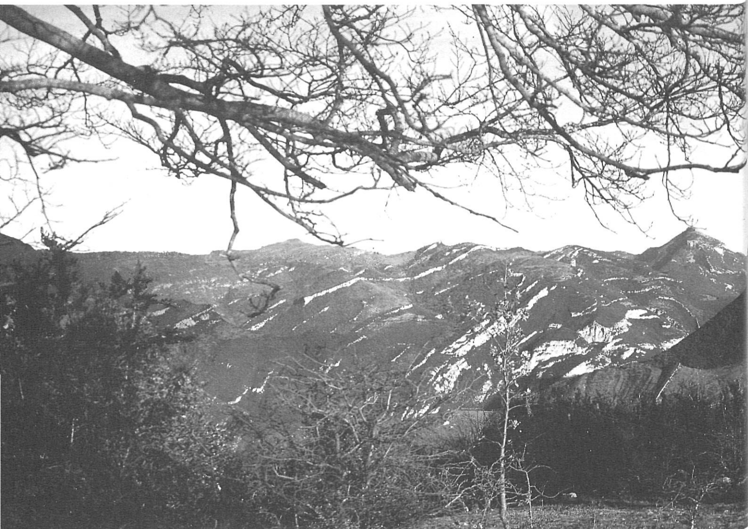
Alta Garrotxa: 30.000 hectàrees de terra de mal tondre, aspriua i dura (Josep Vicente) a l'espera d'una llei que freni l'expoliació i degradació a què es veu sotmesa.