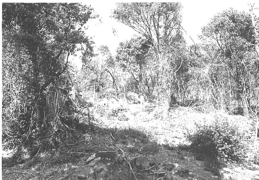
Clar exponent d'una estesa manera d'explotació forestal la constitueix aquest esclarissat bosc (?) d'alzines reduït a la mínima expressió.

vissades a més han provocat nombroses morts) com pels desmunts igualment descuidats que convenientment erosionats omplen els llits fluvials causant llur obstrucció i consegüents aiguats (també han provocat nombroses morts). L'altra gran manifestació d'aquest mal fer és la destrucció de centenars i milers d'arbres, tant per l'espai físic per on transcorre el nou vial com pels moviments de terres que provoca, en zones tan agrestes i d'irregular relleu com és la nostra comarca, sense per descomptat efectuar-ne la més mínima reposició, la qual cosa obliga a qualificar les diferents Generalitats (Catalana i Valenciana), el Consell Insular i el MOPU com els principals desforestadors del nostre país després del foc. Un petit botó de mostra d'això són els 150.000 arbres (roures i alzines) morts en un escàs quilòmetre i mig d'arranjament de la carretera de Bianya o el més esgarriat de l'obertura de la pista de Murrià (digne d'entrar en el Guinness), en la qual per accedir a talar 5 hectàrees de pins propietat del comú de Les Preses, amb un resultat de poc més de 3 milions de beneficis nets, Medi Natural de la Generalitat se'n gastà més de 20 per obrir una pista de desforestació que va arrasar (dins la su-