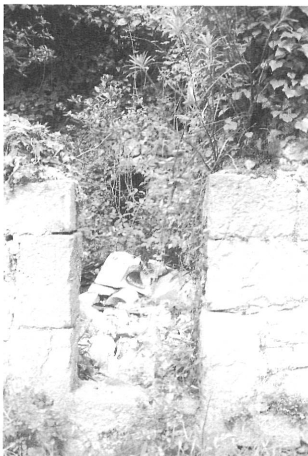
A l'Alta Garrotxa qualsevol indret és bo per a llençar les deixalles.

Malgrat tot això, a hores d'ara ni una d'aquestes iniciatives no ha reïxit en cap estadi superior al paper escrit, i si bé el conjunt d'actuacions denoten la voluntat col·lectiva de preservar l'indret, la manca d'una actitud unitària i decidida ha impedit materialitzar aquests intents. Potser ara seria el moment per assentar totes les parts implicades al voltant d'una taula i d'una vegada per totes emprendre les accions per cercar definitivament el grau exacte de preservació que per les seves excepcionals condicions l'Alta Garrotxa requereix. Mentre, la manca d'un projecte de gestió global que reguli l'afluència de visitants fent-los compatibles amb la salvaguarda de l'entorn natural i del tradicional aprofitament de la zona, fa que es vegin amb gran preocupació actuacions que en poden alterar profundament el valor, com la d'obrir una carretera d'Oix a Beget, una de Beguda a la Mare de Déu del Mont l'asfaltat de la pista de la vall del Bac. Especialment preocupant i que fa preveure una tardor calenta, és l'inici de