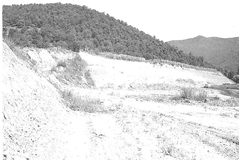
Tal·luscos i desmunts totalment inestables junt a gran desforestació (ni tan sols mínimament recuperada) acompanyen l'arranjament i obertura de les nostres carreteres.

d'arribar a cap estat madur, les resinoses avancen arreu amb l'impuls de la mà de l'home, les pistes forestals proliferen irracionalment provocant grans pèrdues irrecuperables de sòls (ex: a la vall d'Hortmoier de 3 km d'allargada en trobem 22 de pistes de desemboscar, sobrepassant de llarg les directrius europees en aquest sentit) i en general, l'explotació fustanera se'ns mostra com quelcom caòtic i totalment desplanificat. Els plans de gestió forestals, pels quals l'explotació del bosc al seu màxim rendiment es fa possible amb el manteniment de la seva estructura silvícola, sonen a música celestial malgrat els esforços del parc natural per difondre aquest tipus d'aprofitament rendible i ecològic del bosc. La negativa actuació de qui hauria de donar exemple de gestió forestal (Medi natural de la Generalitat), sens dubte contribueix molt a mantenir aquest lamentable estat de les coses.