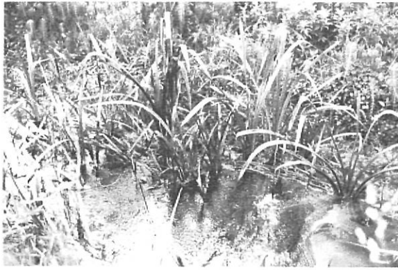
Clar exemple del que han esdevingut molts rierols i rius de la nostra comarca: una gran clavoguera.