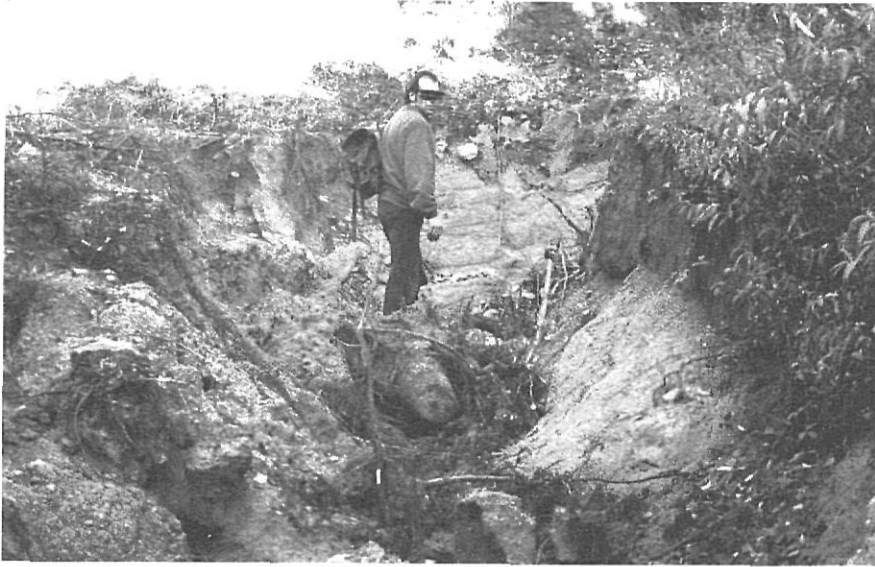
Solc de gairebé 2 m de fondària, provocat per l'erosió que segueix a les obertures irracionals de pistes de desemboscar amb l'agravat de la pèrdua de la capacitat de retenció de l'aigua dels boscos sobreexplotats.