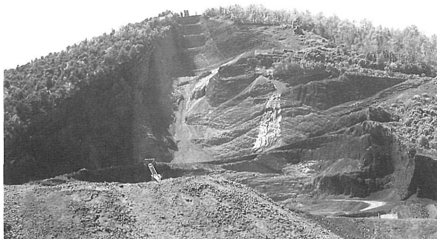
Les extraccions de gredes ja ha arribat al cim del volcà crosat on s'inicia el magnífic cràter estrambolià. Encara no n'hi ha prou?

Malgrat les particularitats específiques de cada una d'aquestes tres parts del nostre territori, ja hem dit que alguns problemes comuns ens els unifiquen. Un d'ells és l'especulació urbanística lligada a l'esgotament de la primera línia marítima, i fonamentada en la potenciació de la zona com a lloc d'interès turístic de temporada com-