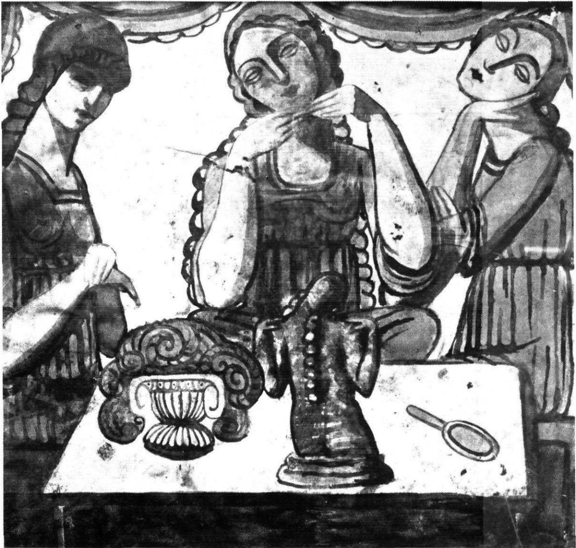
Contribució gironina al Modernisme: Composició de Fidel Aguilar.