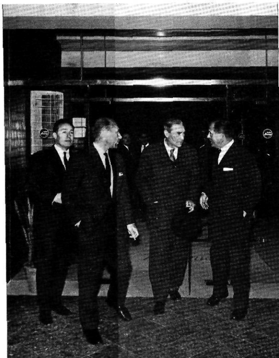
Amb el barret a la mà i bastó, a la sortida d'un acte que tingué lloc a un hotel de Lloret de Mar.

tèntic, malgrat que només interessés aquesta imatge entre popular i comparativa.