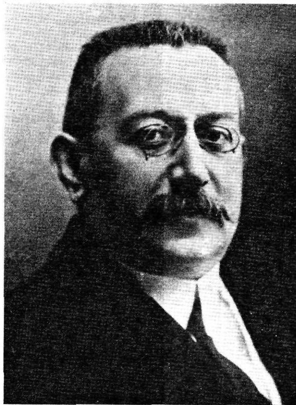
Enric Prat de la Riba (1870-1917)