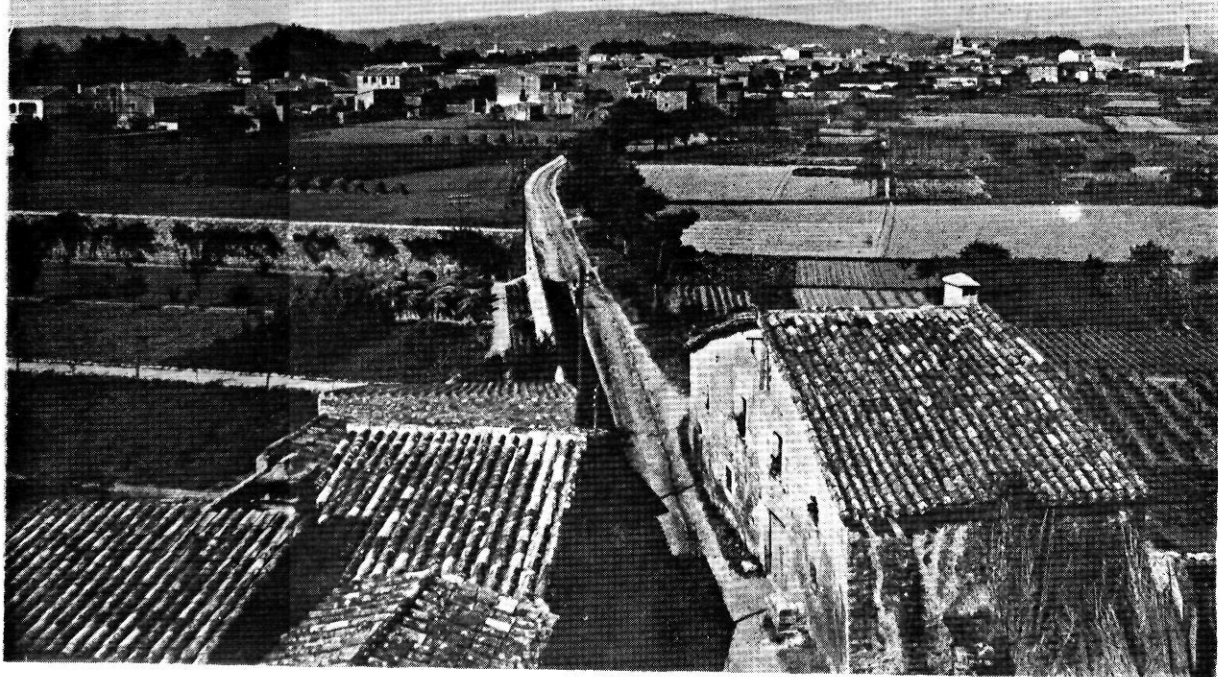
Valenti Fagnoli va recórrer tots els pobles de les nostres comarques i captà el tarannà d'una època passada en la qual el paisatge no sofria les contrarietats actuals: l'exemple de Salt és només això, un exemple.