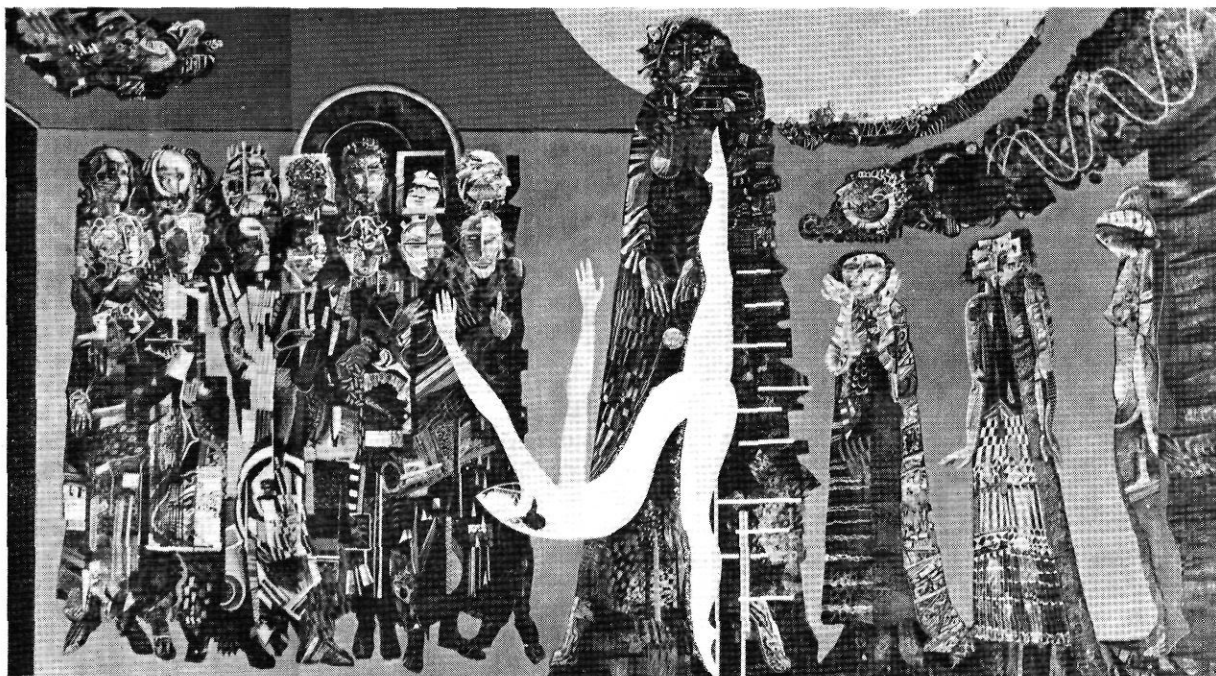
"Retrat imaginari de 24 genis universals", obra de Jesús-Carles Vilallonga.

La personalitat-esperit-sentiment de l'artista Vilallonga és ben reflectida en aquesta obra, com una crida, més real que simbòlica, feta mitjançant el seu art, però valent-se a la vegada d'aquelles persones que, per ser representatives, les ajunta, perquè així aportin cada una el seu símbol, el camí a través del qual ha fet aportació de quelcom positiu per a la humanitat, constituint entre tots, cada u amb el seu ingredient especial un tot d'allò que els homes cerquen, que pot deslligar-nos de les falses o dolentes passions —entenem que hi ha passions bones—, que ens poden alliberar. Són el conjunt de deus que formen el gran cor per cantar una llibertat, o el conjunt d'alquimistes que han aportat el seu petit però important secret, perquè una vegada conjuntats, aconseguir la panacea somniada. Una O.N.U. de l'esperit per a homes esperançats, que siguin ells els qui assenyalin el camí i la manera de fer el recorregut.