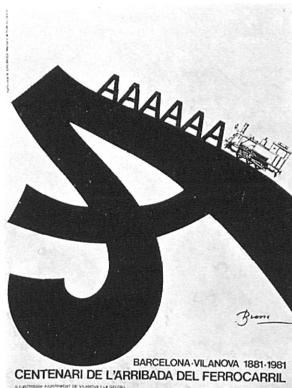
Centenari del ferrocarril Barcelona - Vilanova, 1981.

Joan Brossa s'ha apropiat a nosaltres. Sempre ha estat entre nosaltres amb la seva obra resultant del seu esperit. Ara ens l'ha mostrada