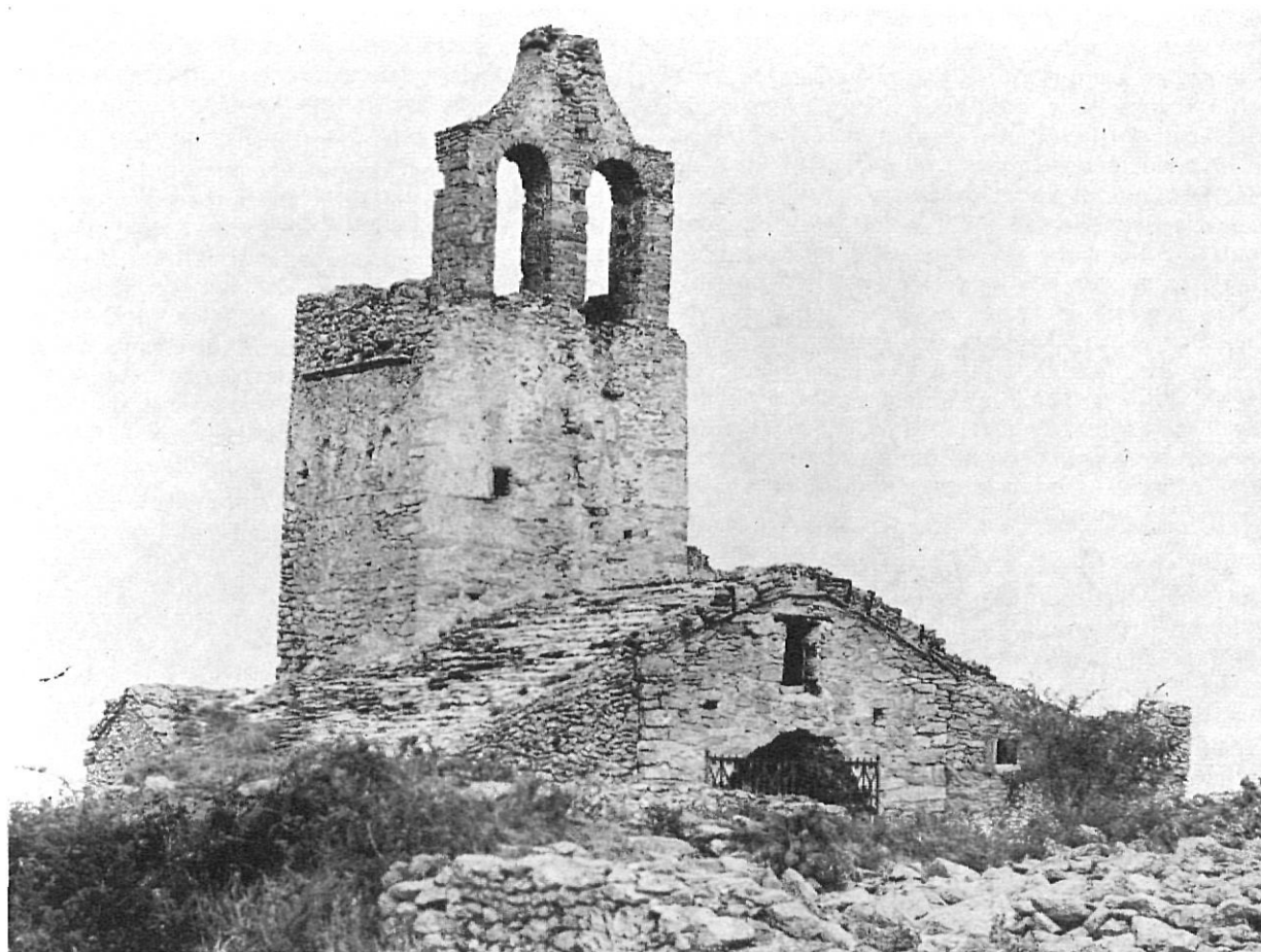
Santa Helena, prop Sant Pere de Rodes.

dedicada també a Sant Joan com una segona advocació. Avui és una església ruïnosa, i fou una antiga sufragània de Santa Creu de Rodes, fins que l'any 1572 totes dues i, segons sembla també la de Sant Fruitós de la Vall de Santa Creu, foren agregades a la parròquia de la Selva de Mar.