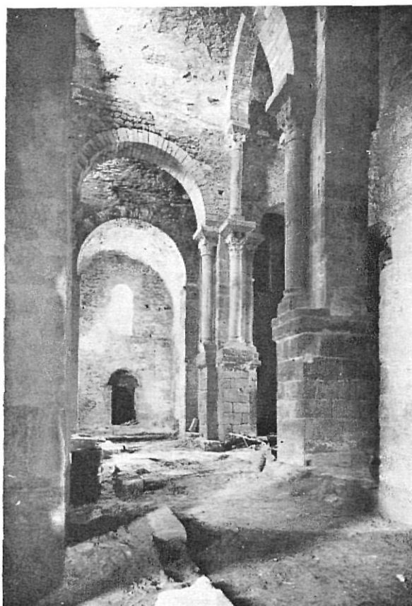
Interior de l'església de Sant Pere de Rodes.

Però a la butlla de Benet VI s'esmenta també « Eclesiam sancti Vincentii que est in valle Lanciani ». Aquesta església de Sant Vicens de la vall de Llançà tampoc no l'havíem trobada en