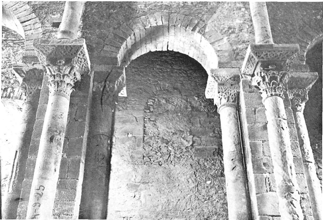
sant pere de rodes