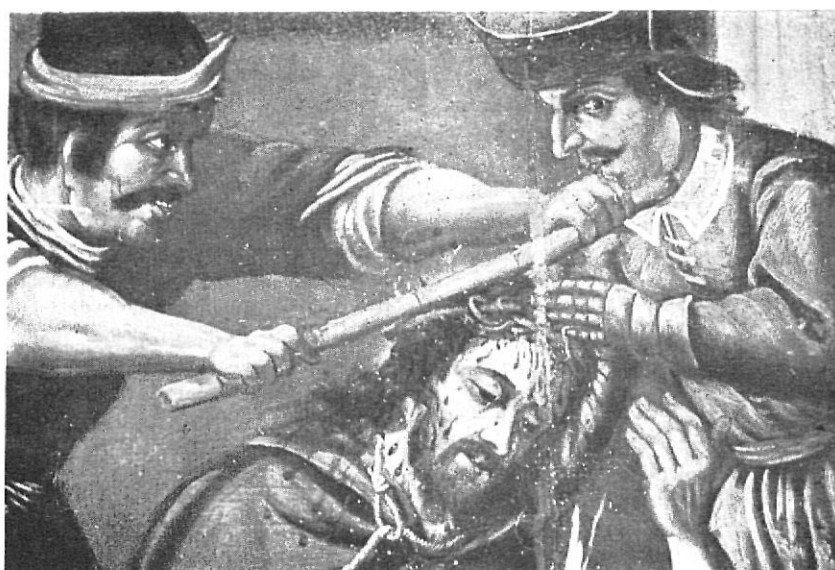
Coronació d'espines: detall ampliat.

L'autor va trobar la manera de contraposar les dues figures centrals del quadre. Damunt d'una estrada i assegut en una poltrona la figura de Pilat, que amb la mà dreta estesa entrega Jesús als jueus, com diu literalment l'Evangeli. A l'extrem oposat i dempeus a terra, per tant a un nivell inferior, hi ha Jesús amb les