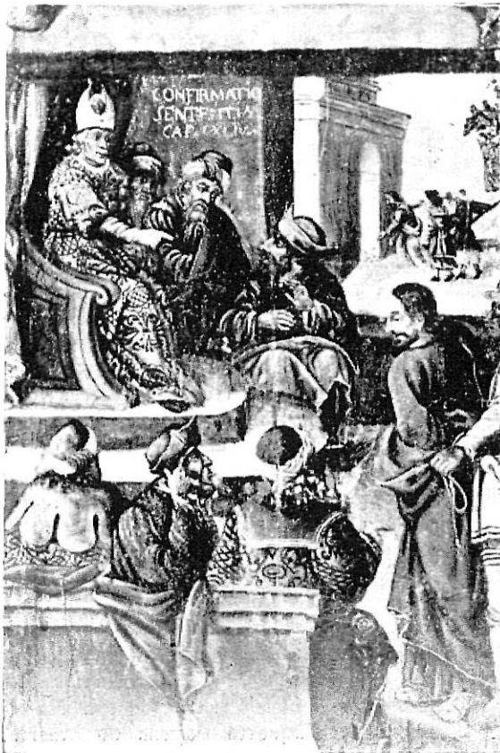
Sentència de Pilat: conjunt

Encara avui algun guixolenc, conciudadà nostre, segurament podria donar més referències sobre aquest capítol de la petita història de Sant Feliu. La Capella, com he dit abans, no era molt nombrosa. A part dels nens cantaires, hi havia dues veus de tenor, dues de baríton, i una o dues de baix. Juli Garreta pertanyia, si no m'equivoco, a la corda dels barítons. M'ha semblat oportú recordar aquesta faceta, probablement poc coneguda, de la seva vida, en l'avinentsa del centenari del naixement, que s'escau aquest any 1975, d'aquest il·lustre músic fill de Sant Feliu.