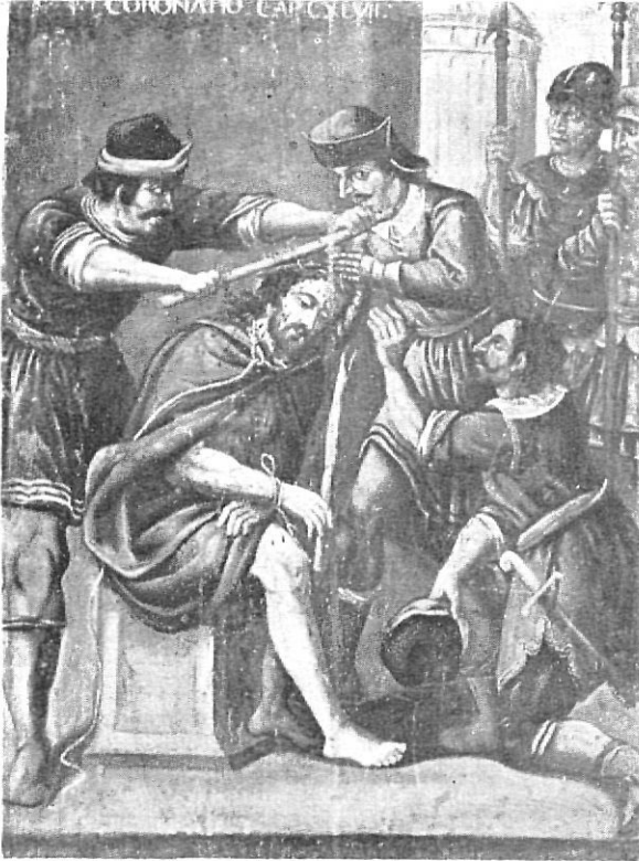
Coronació d'espines: conjunt.

Al fons del quadre, a la dreta de l'espectador, l'autor aprofità l'angle superior per posar, en miniatura, dues escenes relatives al traïdor Judes. Primerament hi ha aquest apòstol llençant a terra les monedes d'argent, i darrera seu hi ha dos personatges que s'ho miren. Ben bé a l'angle superior hi ha encara representat el fruit de la desesperació: el cos de Judes penjat d'un arbre.