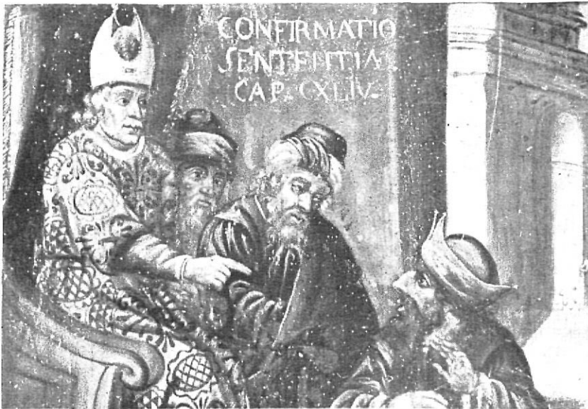
Sentència de Pilat: detall ampliat.

litat i realisme. I en quant a la concepció, la llei fonamental de la simetria que presidia en el gòtic l'ordenació de les figures, cedeix el lloc a una distribució també pintoresca dels grups. Aquestes característiques del protorenaiement de casa nostra es troben, sens dubte, en aquests retaules de Sant Feliu, i per això m'inclino a datar-los de començaments del segle XVII.