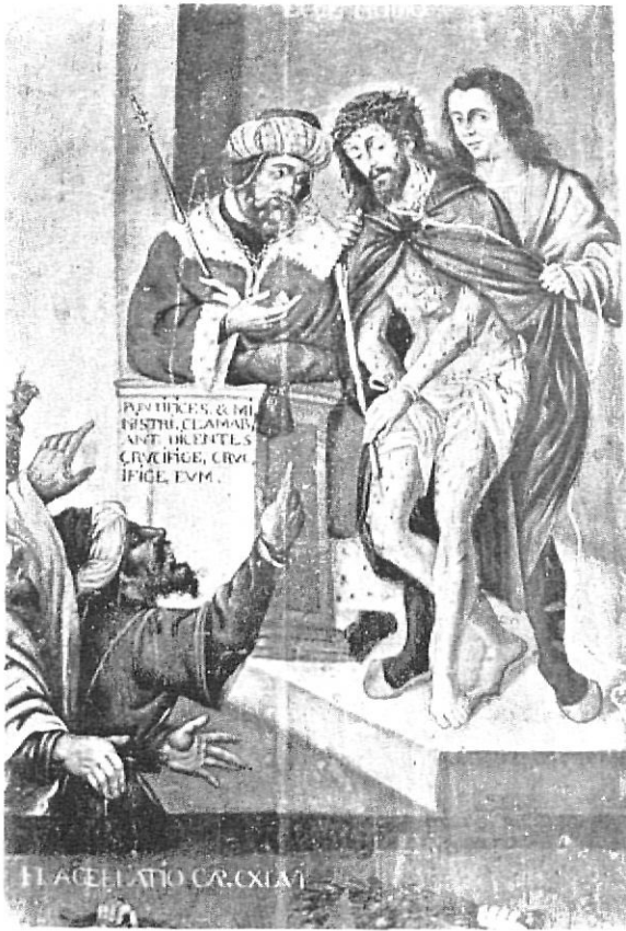
Ecce Homo!: conjunt.