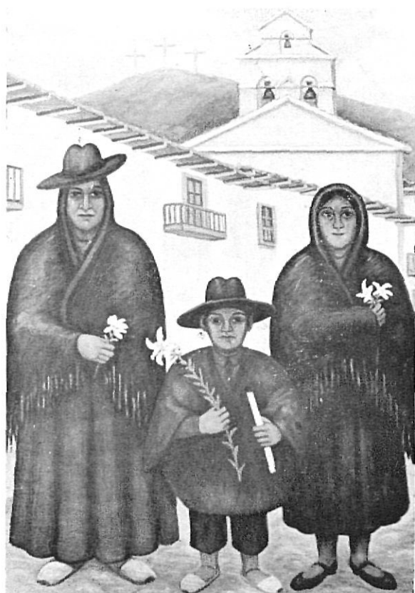
Penitents, de J. Ramis

Historiador, o recopilador de dades que ens interessin a tots nosaltres, fou en Josep Ramis, a més d'un excel·lent pintor.