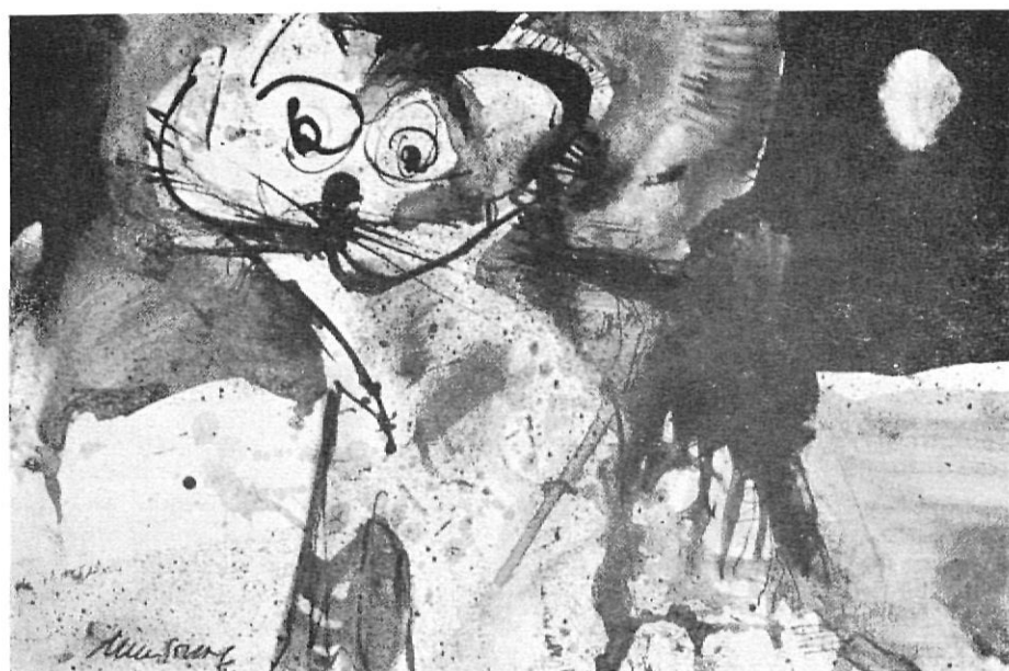
Josep Ministral. Sèrie Gats i Gossos (1980-82).

Sent per als ocells una gran veneració. Per això quan els pinta és com si fes una denúncia contra aquells que directament els maltracten, o les circumstàncies desfavorables amb què es troben, moltes vegades per culpa de l'home. Ocells abatuts pel dany que els pren la vida. Com adéus, acomiadant-se d'una curta vida plenament lliure per a ells, fins aquell moment, que