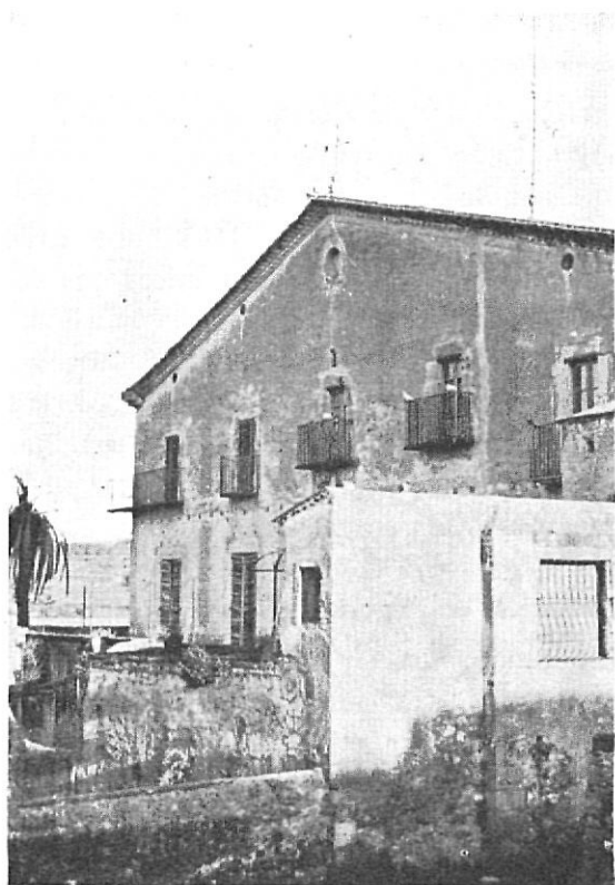
Casa Ros de Les Olives.

sabe que el sepulcro del mártir Sant Feliu en Gerona era constantemente venerado, pues ya en el siglo IV el poeta Prudencio lo nombraba y en los siglos VII al IX tiempos en que se construyeron las iglesias mencionadas, verdadero rosario de fe que va de Ampurias hasta las tierras gerundenses, prueba dura de un camino de peregrinación que data de épocas romanas, visigótica y carolingia por monumentos que aún hoy en día se pueden admirar.